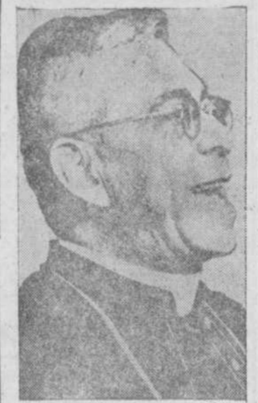
Monsiñor don Luis Martínez, arzobispo de Méjico, que ayer llegó a la capital de España