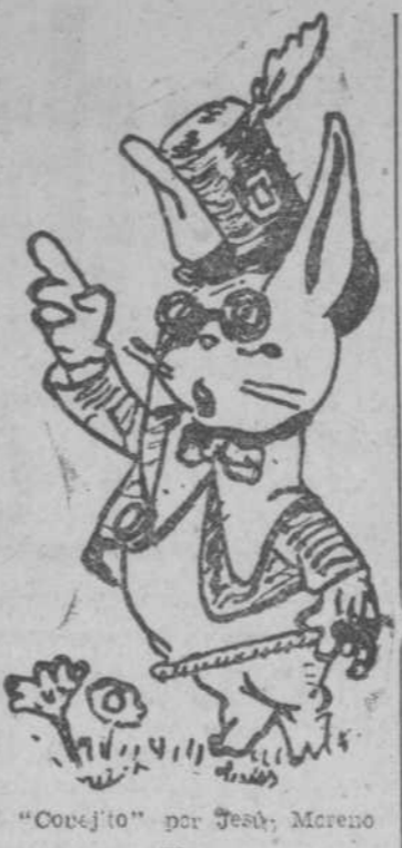
"Cobajito" por José Moreno Plaza.

HILARIO GARCIA Cirujía - Huecos y Articulaciones Rayos X, portable a domicilio Domíngos a las 005 - María Aziladora, 31 C. S. n.º 146