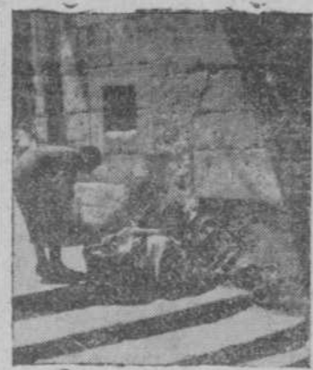
tescas obras, por los muchos preparativos y lo que tardan en "acondicionar el terreno", en las Cuatro Calles que, al parecer, es su destino.

Entonces... era entonces, afuera la industria callejera es diferente y no es preciso ir a buscar a los compradores, que saben ya ese camino de la Plaza de San Justo, donde "hay lo que no se vende en los comercios" y donde se alcanzan los tenderetes que dan a la plaza aspecto de zoco, en espera de que se realicen lo que parecen ser gigan-