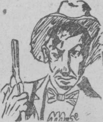
"Max Dalton", por José Luis García Sainza.

Asignura, Calto, por Hércules y Sileno, que caso, por ser tan bueno, le haya dividido un poquito; mas como no existe mito, y pese a ser poco amano, verás que al fin resulto aunque lo dude el galano. Ya sé que día tras día y semana tras semana esperas; con febre sana ver figurar tu poesía; mas por Eutapas y Lia, por Ores y por Diana le aseguro que tenía de complacerte gran gana. Pero el tiempo, siempre escaso, por Baco, no ha permitido que cumpla lo prometido haciendo a tu oferta caso. "La culpa del tiempo ha sido", como decía Garcilaso;