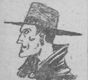
"El hombre d'atónico", por Carlos Pérez.

JULIO PEREZ MARTIN MEDICO MATRIZ Y PARTOS Consulta a las doce San Justo, 22 - Teléfono 1305 C. S. núm. 28