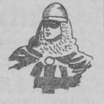
"El guerrero del antifaz", por Luis H. Rivas de Rollán.