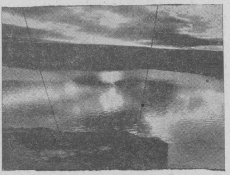
"Nuestro Tormes, detenido por la ya importante barrera de la presa, es un gran lago tranquilo en la bella puesta del sol"