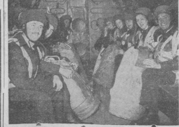
En la foto, una "exposición" de enfermeras, prontas al lanzamiento

En esta ocasión se está haciendo un examen a un grupo de enfermeras de la R. A. F. y después "acreditar su valor", arrojándose con paracaídas. En la foto, una "exposición" de enfermeras, prontas al lanzamiento