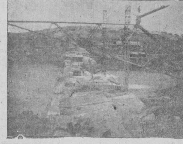
Una vista actual de la presa elevada ya a la cota 10, en su parte más baja.

El salto de pie de presa, precisará también obras de consideración para sus instalaciones técnicas y los canales, de cuyo alcance hablaremos en días sucesivos, representan también una gigantesca empresa.