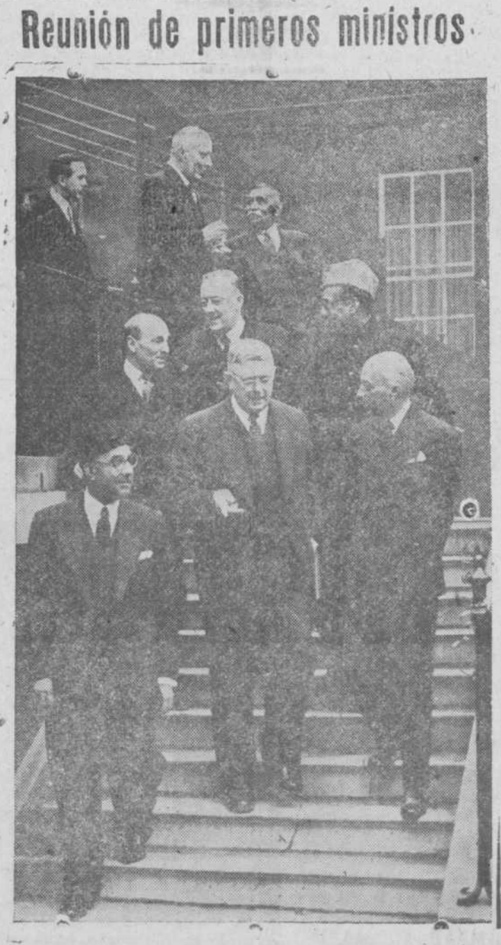
Los primeros ministros de la Comunidad británica de Naciones al salir de la reunión celebrada recientemente en Londres.

Reconocemos que el perfil se nos ha pasado una fecha, por esa sencillísima razón de ser un poquito afortunados en eso de "estirar" la ración de tabaco. Y fué ayer, precisamente por la falta de puntualidad de la Tabacalera al suministrar el racionamiento, cuando tuvimos necesidad de "solicitar" uno de esos paquetes de ideas (¡...!), comprobando que habían subido nada más que cincuenta y cinco céntimos. Por eso llegamos tarde para enterarnos del acontecimiento, que ya era del dominio público. La subida no ha sido atroz, y si sólo conocida por las listas expuestas en los estancos, ante las que nos hemos quedado boquiabiertos—valga el gesto—ya que los nuevos precios fijados para las diferentes labores son bastante motivo de asombro. Ahora si se impone la constitución de la "Liga de no fumadores", pero liga forzosa, en lucha contra la C. A. T., iniciales de la Compañía Arrendataria Tabacos, que si bien pudieran corresponder también a "caro, asustoso y tóxico", aplicado al tabaco. GEACHE