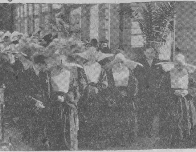
La foto representa a la reverenda madre Blanchot, superiora general de las Hijas de la Caridad, acompañada de médicos y hermanas de la Caridad del Hospital provincial de Madrid, durante su visita a dicho establecimiento.