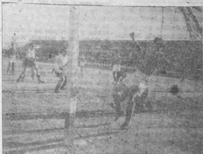
Un momento de peligro para el Tomelloso pero el balón ha saltado fuera.