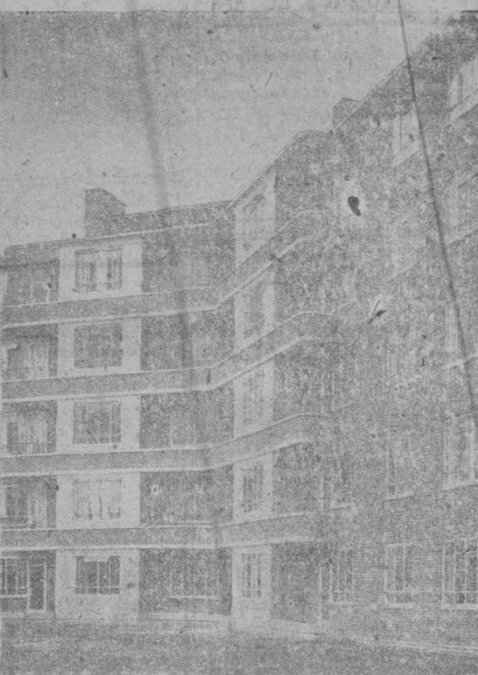
Recientemente se inauguraron en Lambeth, uno de los barrios más densos de Londres, las primeras casas de pisos terminadas después de la guerra. Los pisos tienen dos, tres o cuatro dormitorios.