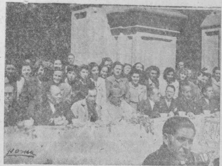
La mesa presidencial, durante el desayuno de los asambleístas, en el Seminario Mayor.

En el Ministerio italiano de Asuntos Exteriores se ha anunciado que tal propuesta sería rechazada de plano. (Efe.)