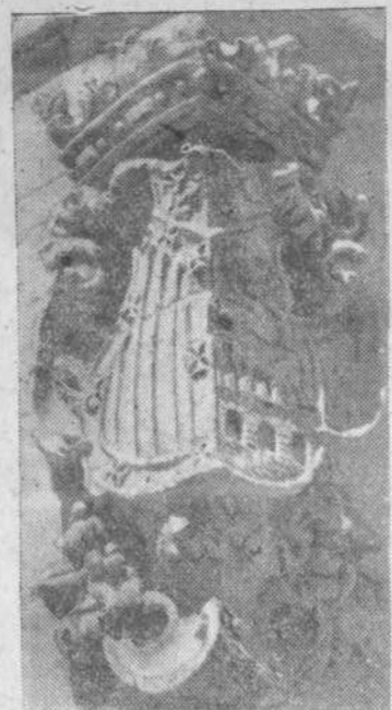
Escudo de Salamanca, en piedra, sito en la fachada posterior de la Plaza Mayor, es que se inspira la nueva Medalla de la ciudad.

Está inspirada en uno de los escudos representativos de nuestra ciudad