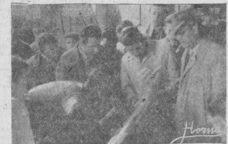
Examinando el funcionamiento de una de las máquinas de la Escuela Elemental de Trabajo.