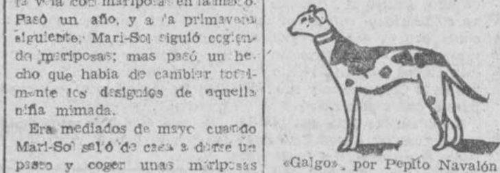
«Galgos», por Pepilo Navalón