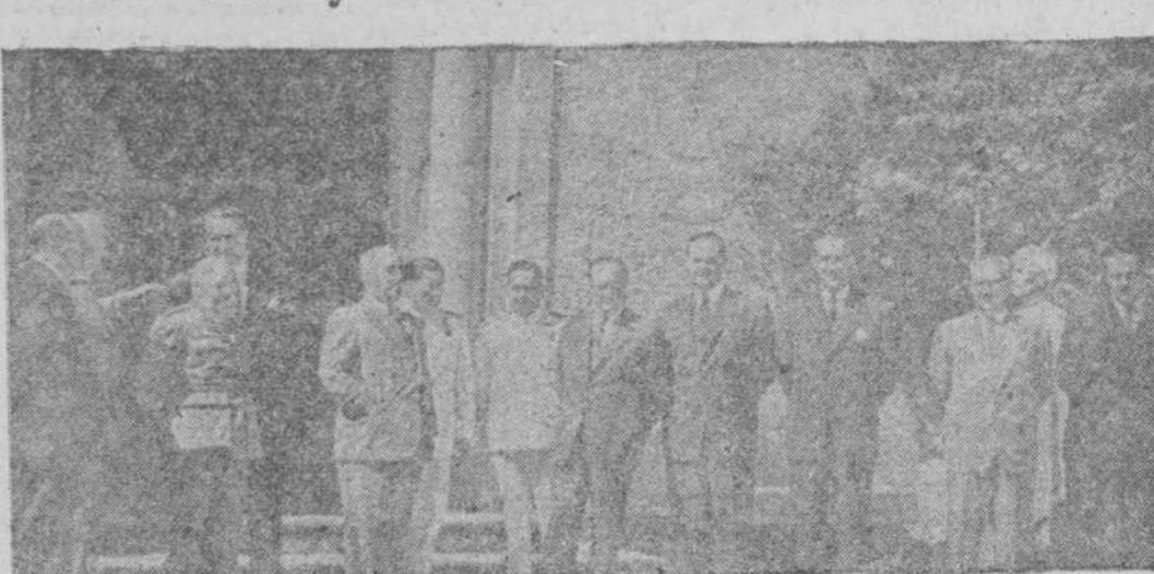
Recientemente se ha celebrado Consejo de Ministros bajo la presidencia del Generalísimo Franco, en el Pazo de Meirás. El Caudillo y el Gobierno momentos antes de reunirse.