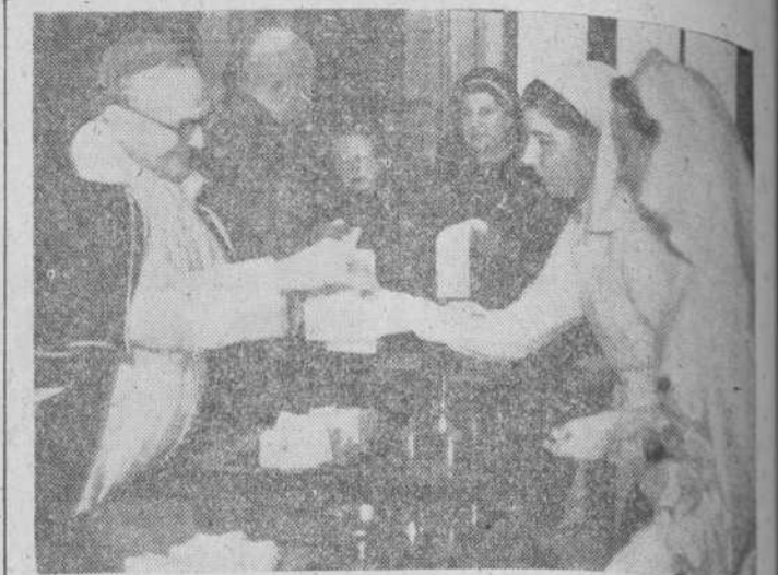
Entrega de los títulos a las nuevas enfermeras en el salón del Excelentísimo Ayuntamiento, en la mañana del domingo.

Hizo el señor Pérez Villanueva historia de la Cruz Roja, no sin antes evocar la figura de aquella gran reina Isabel la Católica, que por serlo en alto grado, y en la vega granadina, fundó los primeros grupos de ayuda a los combatientes durante la reconquista. El germen de la formación de la Cruz Roja—evocó el señor Pérez Villanueva—tuvo lugar en el siglo XIX, cristalizando en una reunión internacional,