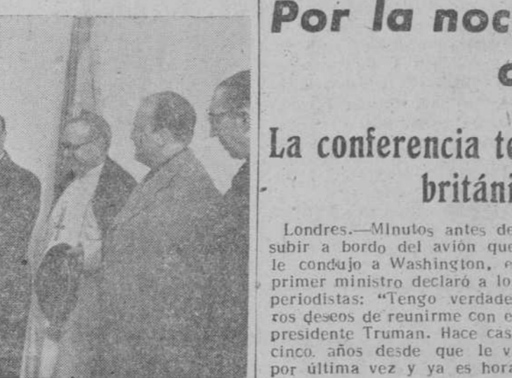
Presidencia del acto en el Barrio Salas Pombo durante el discurso del Delegado Provincial Sindical.