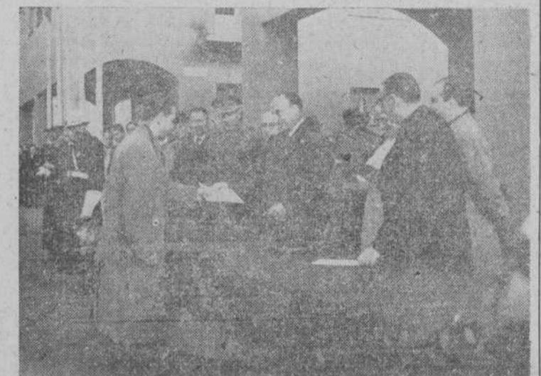
El Director General del Instituto Nacional de la Vivienda entrega los títulos en el Barrio Vidal.

G. POLO Enfermedades de la mujer. París. Consulta de 12 a 2. Teléfono 2611. Crespo Rasón, 17, 1.º. C. S. 1.º