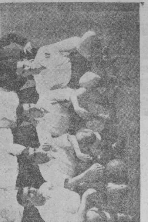
(Gil, en "Arriba")

MERECIO EL TRIUNFO Reproducimos en esta página los comentarios de los más destacados críticos deportivos madrileños en relación con el partido Plus Ultra-Salamanca, jugado el sábado último, en el estadio de Chamartín, y en los que abundan los elogios al conjunto de Chamartín, y en los que abundan los elogios al conjunto de Chamartín. Complemento de la amplia información que nos sirvió el sábado la Agencia Losos, son ahora estas fotos de Santos Yubero: en la parte superior, un momento de verdadero apuro ante la meta plusultra; en la inferior, los ondulantes que conquistaron ese estupefante punto positivo.