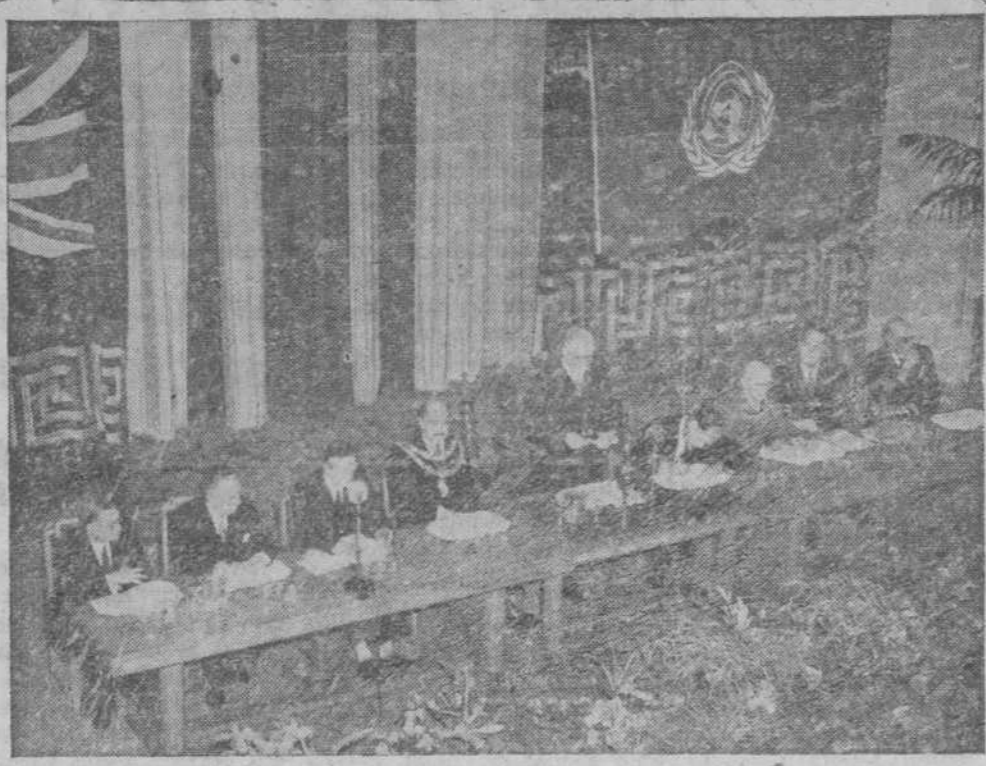
En Torquay (Inglaterra), se han reunido recientemente delegados de treinta y nueve naciones, que trataron de la reducción de las barreras aduaneras, en beneficio del comercio mundial, una de cuyas sesiones coge el fotograbado