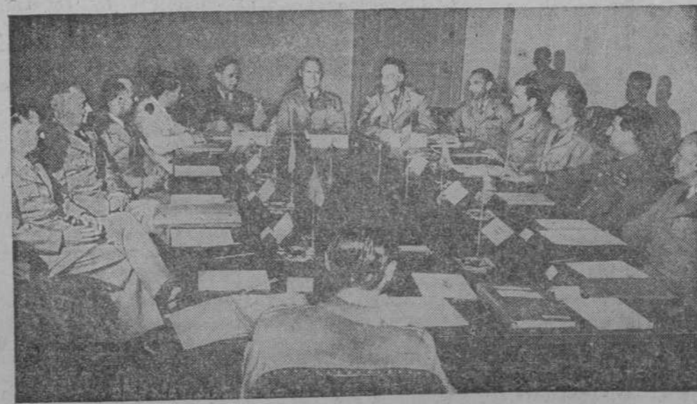
Una de las reuniones celebradas en Washington por los jefes militares de las potencias signatarias del Tratado del Atlántico Septentrional