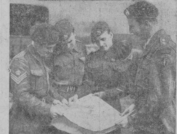
Los jefes de algunos destacamentos de Marina británicos en Corea, examinan mapas de operaciones

Washington.—No se ha llegado a ningún acuerdo por parte de Gran Bretaña, Francia y Estados Unidos, sobre el establecimiento de una zona desmilitarizada entre Corea y China. (Continúa en 4.ª plana.)