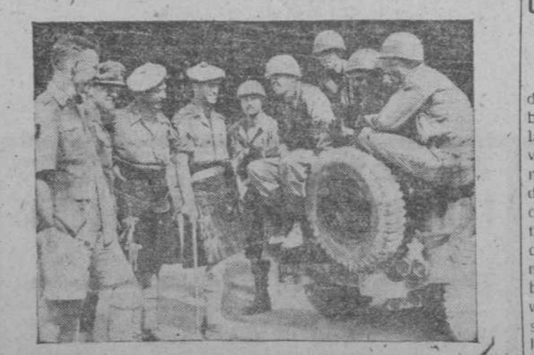
Oficiales de las tropas británicas en Corea charlan con los soldados norteamericanos en un campamento