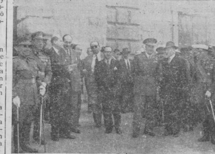
Las autoridades a la salida de la fiesta religiosa

Ayer tarde, paseando por la carretera de Valladolid, surgió en nuestra imaginación aquel recuerdo. Y al mirar hacia el limpio y coquetón jardincito del Asilo y a la blanca imagen de San José, vimos ante ella una gran regadera. No fue la ingenuidad de antaño, sino la meditación del presente. ¡Las monjitas pedían agua! Remedio no sólo para sus propias necesidades, ni de los añclantos asilados, sino para todos los que hacemos igual demanda y que, en esta ocasión, no representaba una solicitud que al alcance de los que podían estaba; la petición se dirigió fuera de todo lo material y se transformaba en una plegaria por el beneficio de la lluvia, que tenía, en el simbolismo de la regadera, todo el encanto ingenuo y sencillo de una súplica emocionada.—JAVIER.