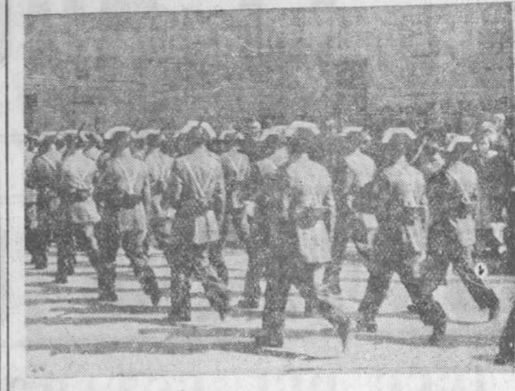
La Guardia civil desfila ante las autoridades

(Viene de primera plana.) dental y cristiana que la nave lleva en su seno. Un futuro posiblemente no muy lejano quizás nos permita comprobar si esta hipótesis pesimista de la zozobra de Europa resulta excesivamente desmembrada. En todo caso, un hecho hay cierto: Que en nuestro tiempo ha sido rebasado el concepto de Europa como fenómeno hegemónico. Suficientemente constatado ya por los dramáticos acontecimientos de los últimos años es que Europa no puede entenderse de América, ni ésta de aquella. (Grandes aplausos.)