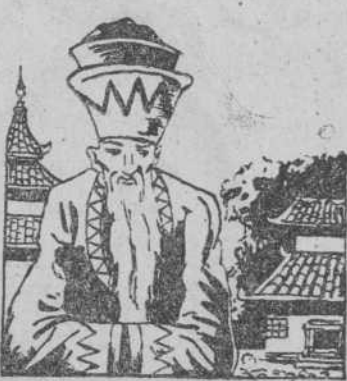
Emperador chino, por Domingo Vicente.

creéis valeros vosotras mismas, y os engañáis. ¿Qué hubiera sido de vosotras sin los hombres que os labraron y sin los modelos que imitaron esos hombres? Esos modelos somos nosotras; esas piedras viejas que no sabéis para qué sirven, que creéis quitan belleza a las calles, no entendiendo que sois nuestro mismo espejo. Cuando os miráis tan limpias, y cuando después volvéis a mirarnos a nosotras, nos veis viejas, cubiertas por la patina del tiempo, y os sentís elevadas sobre nosotras; pues sabed de una vez, que si poseéis algo de belleza es un reflejo de la nuestra y que nosotras estamos muy por encima de vosotras. Las viejas piedras callaron, mientras las nuevas enrojecían de vergüenza, o quizás, porque los rayos del sol empezaban a dorarlas con sus reflejos. Y yo, con sonrisa alegre, seguí recorriendo mi ciudad natal que a cada minuto me parecía más bella en el contraste viejo y nuevo de sus calles.