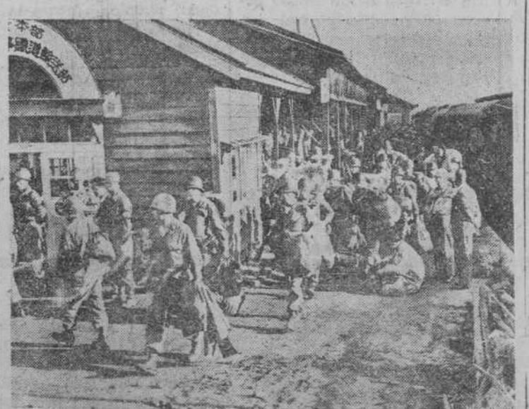
Tropas norteamericanas descendiendo del tren en una estación de Corea para dirigirse al frente.