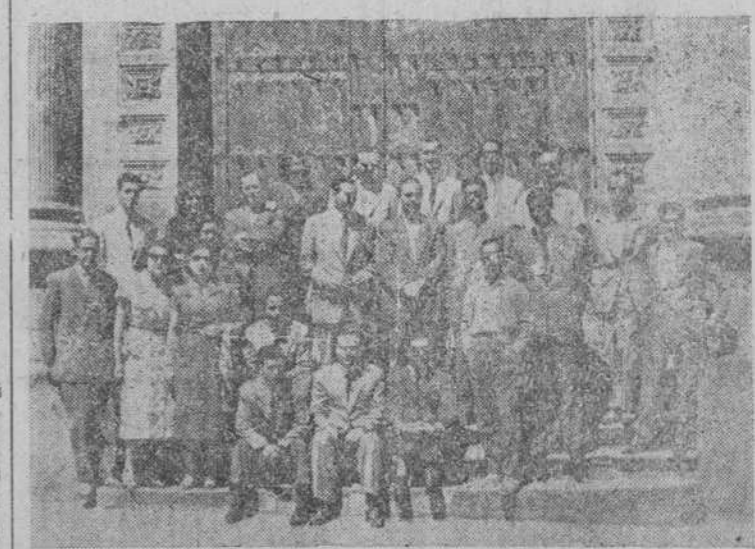
Los cursillistas de Química textil con los profesores, en la puerta de San Martín, durante su visita a Salamanca verificada ayer.

En la mañana de ayer, llegaron a Salamanca la mayor parte de los cursillistas que asisten al Curso de Química Textil en la Escuela Industrial de Béjar, organizado por aquella entidad con la colaboración de la Universidad salmantina y otras asociaciones culturales.