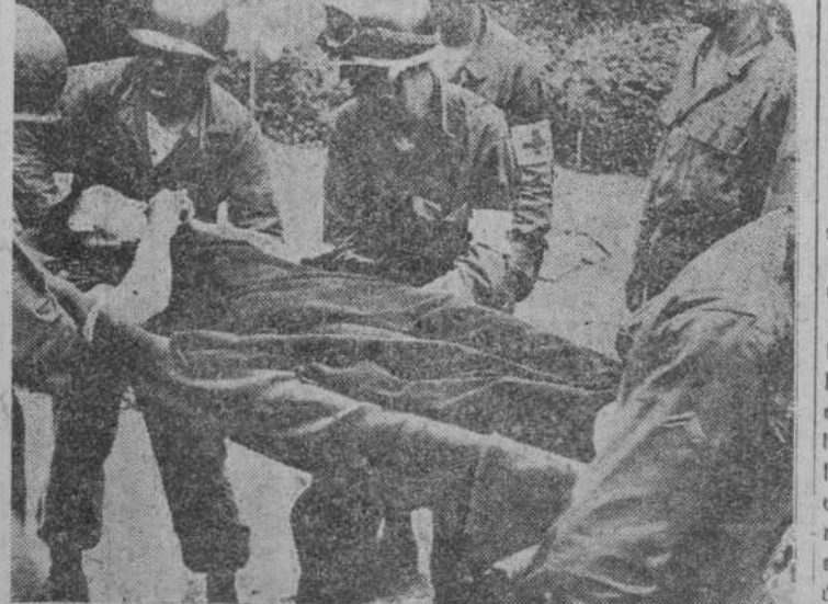
Las tropas de Sanidad norteamericanas se han distinguido por su heroísmo en la campaña de Corea. Aquí aparecen evacuando a un soldado herido