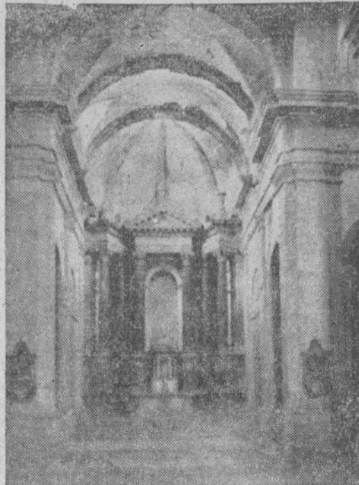
Capilla central del Monasterio.

para todos, y terminará por caerse por completo, sobre todo la hermosa iglesia, que es una maravilla de arte, sin que se le vea solución alguna, a pesar de los llamamientos y ruegos de los mirobrigenses desde hace varios años. Por eso los que con tanto placer y alguna frecuencia realizamos una visita al derruido convento de la Caridad, nos produce la misma impresión que nos causaría una tumba sin flores. Solo, en medio de la ribera del Agueda, abandonado, sintiendo morir día tras día —que cada piedra que se derrumba es una gota de sangre que pierda para no recuperar—, la Caridad, este Monasterio milenario, llora al contacto de los recuerdos.