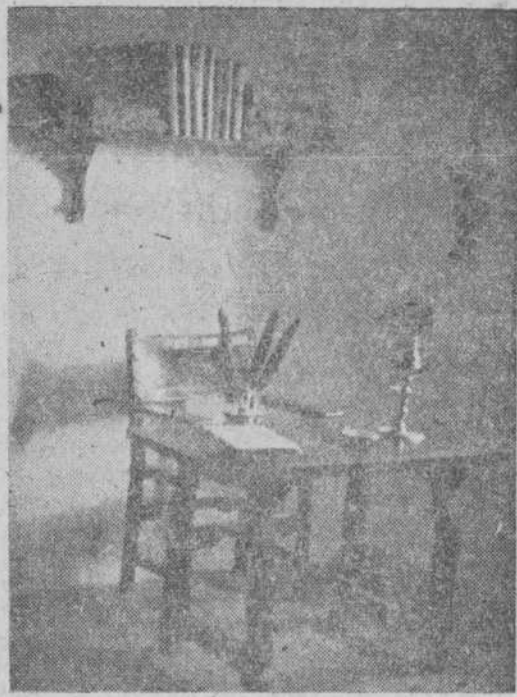
Una de las celdas, tal y como se conserva.

En las frondosidades, junto al río Agueda, se destacó uno de los Monasterios, el más histórico de los muchos que hubo en Ciudad Rodrigo, el de más gratos recuerdos para los mirobrigenses y al que visitan todos los años. Este es el Monasterio de la Caridad, a cuatro kilómetros de esta ciudad, el cual fue fundado por los frailes premostratenses de San Norberto hace nueve siglos el primero de ellos, y sobre las ruinas de éste se ha levantado otro majestuoso, aunque se encuentra también derrumbándose, cuya iglesia y portada, que es maravillosa, se construyeron en 1590. Cuentan que la soberbia fachada fue construida por un légo de la misma Orden de los Premostratenses, el cual murió de pesadumbre que le dijeron que estaba falsa, aun cuando el tiempo ha demostrado que es una fortaleza, pues es lo único que se conserva intacto.