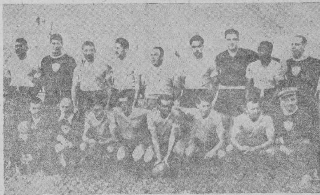
La selección uruguaya

Sao Paulo.—El mal tiempo ha hecho que el Estadio, con capacidad para setenta y cinco mil espectadores, no se llenara totalmente. No obstante, los claros fueron muy reducidos. Por primera vez en el torneo para la Copa Jules Rimet fueron interpretados los himnos nacionales de los países que jugaban en el del Brasil. Desde las primeras horas de la mañana había en el campo numerosos españoles de Sao Paulo y otras ciudades del Brasil. Algunos han realizado viajes de dos mil kilómetros para asistir a este encuentro. Ante la tribuna de honor ondeaban las banderas de España, Uruguay y Brasil.