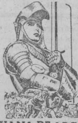
JUANA DE ARCO

Gran Teatro Bretón A las 4,30, 7,45 y 10,45, repatriación de la película "CAMPEONA de la historia del cine en Salamanca"