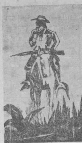
"Un explorador", por Domingo Vicente

Acercándose un loco cierto día a la jaula de un pobre ruseñor, cantaba muy bien y mucho: "¡Canta muy bien y mucho!"