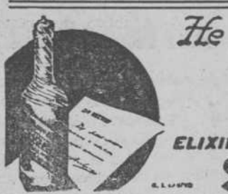
He aquí... ELIXIR ESTOMACAL SAIZ DE CARLOS