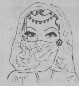
"Mujer árabe", por Pilar Sesma

Sospechando el cabrejo, que el guarda-bosque y su mujer se darían a la fuga, contó ce por ce al procurador, todo lo que sabía acerca de la desaparición de Manuel, y aquel lo puso en conocimiento de las autoridades competentes al caso, y aquel mismo día, fueron conducidos a la cercana ciudad, donde fueron reducidos a prisión, y en donde días después morían condenados a la horca. El criado del conde, Santiago, por haber sido cómplice indirecto del crimen, fué sentenciado por los tribunales a cadena perpetua.