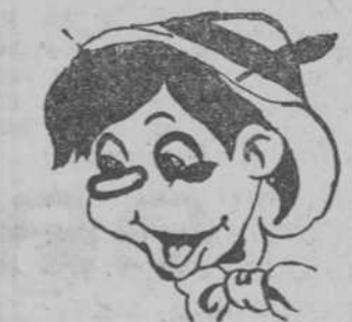
"Pinocho", por Emilio García