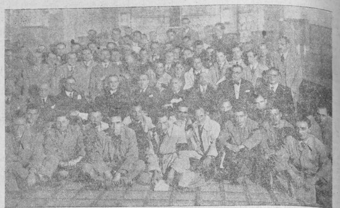
El Consejo de Administración de la Caja de Ahorros, rodeado de los cursillistas que ayer visitaron las instalaciones de dicha entidad

Ayer tarde, los asistentes al cursillo de habilitación de secretarios de Administración Local de tercera categoría, que