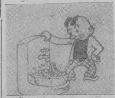
"Huevos frescos pasados por agua" por Carlos González López

TUBERIA GALVANIZADA Y NEGRA para conducción de agua, gas y calefacción, etc. NECESITAMOS REPRESENTANTES activos e introducidos en el ramo. CONSTRUCCIONES «ELECTRON» Apartado 235. VALLADOLID