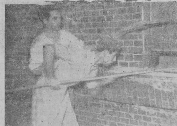
El palin lleva al horno una serie de panecillos, que serán colocados en formación magnífica para aprovechar toda su difusión.

En ellas, encendiendo los hogares, amasando, pesando las masas que la máquina distribuye en raciones, formando los bollos, colocando éstos en los palines y con ellos en el horno, y sacando luego las tandas a los amplios cestos, trabajan en turnos un buen número de obreros de bien diversas especialidades. La visita que hicimos a una de estas industrias, para obtener las fotografías, nos mostró cuadros impresionantes que jamás habíamos visto y nos sugirió la idea de hacer un reportaje próximo que titulado "Como se hace el pan de cada día", vendrá a estas columnas, por lo que no es esta ocasión de meter las manos en la masa... La visita fue amplia y nuestra molestia se vio recompensada con el obsequio de un bollo, recién salido del horno, que a las cinco de la mañana inge-