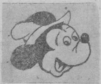
"Mickey", por Victoriano González Martín, de Rollán

Es un día espléndido; los rayos poderosos del astro rey caen perpendicularmente sobre la eterna llanura castellana. Me encuentro situado en un pequeño montículo en las cercanías de la ciudad burgalesa, y ante mis ojos se presenta un panorama lleno de soledad y tristeza. Pero no por eso Castilla, centro y corazón de nuestra querida Patria deja de ser bella y hermosa. Los enormes rastros donde pocos días antes se habían encontrado los pequeños granos de trigo, se extienden infinitos hacia el horizonte. Por allí pasa un camión polvoriento, por el que marcha un andarín sudoroso y cansado, en busca de un pequeño arbolito en donde poder descansar de las fatigas del camino. El Arlanza cruza solemne y majestuoso la llanura, sin encontrar en su camino algo que pueda impedir su loca carrera en busca de su fin. Sobre mi cabeza se alza un cielo terso y limpio como una gran sábana azul que no tiene fin, y que se pierde allí donde mis ojos ya no la pueden seguir. A lo lejos se divisa un castillo señorial, y eso me hace recordar en aquellos tiempos lejanos en los que se veían encima de sus almenas las lanzas de los guerreros. Castilla es así de fuerte y segura: