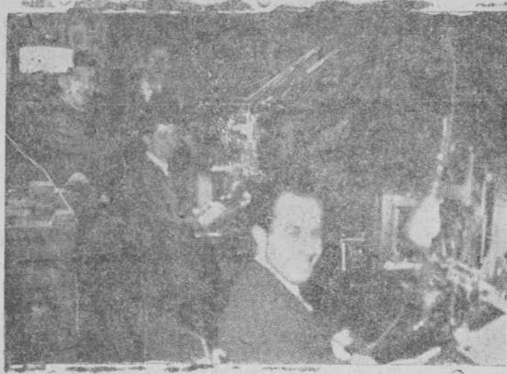
Los linotipistas de EL ADELANTO, con los mecánicos, no creían, al hacer esta foto, que iban a salir en "los papeles".

Por toda la ciudad, en infinidad de garajes, hoteles, comercios, establecimientos bancarios... viven la noche un buen número de hombres. En los primeros, estos hombres atienden al automóvil que llegó a última hora o, también, al que por avería requiere la atención del mecánico, al que el sereno habrá de llamar en este caso. En los hoteles, además de la posible llegada del viajero, habrá de atender, el conserje de noche, a cualquier petición de un huésped y preparar las llamadas de los que en la madrugada emprenderán viaje; en los comercios, aunque con mayor tranquilidad, no falta al sereno la molesta obligación, controladísima en muchos casos, de la ronda por el almacén, lo que en los establecimientos bancarios requiere una mayor atención. Otros muchos refuerzos de vigilancia y cuidado nocturno se hallan, durmiendo, sí; pero fuera del hogar, porque el turno del servicio así lo requirió. Y no olvidamos, por último, los que en otra actividad