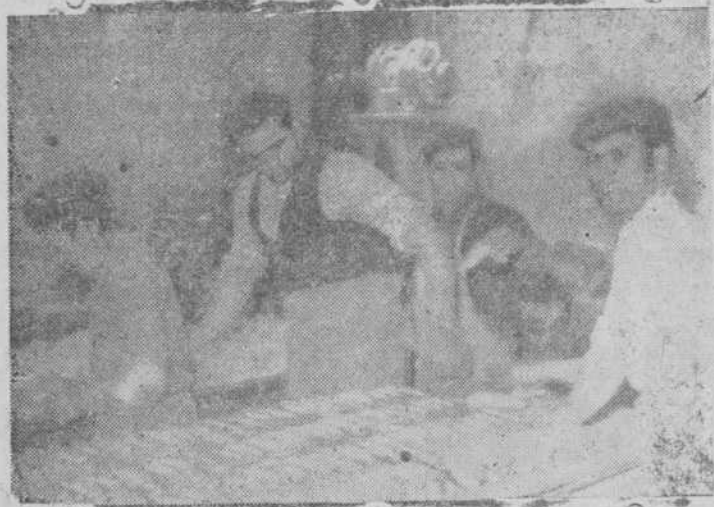
En la panadería, y en agitada actividad, estos hombres van hincando la masa para la formación de los panecillos.

Y nada más. Cuando vamos para nuestra casa cada día, y sobre todo en aquellas jornadas de guardia que nos hacen escuchar las cinco