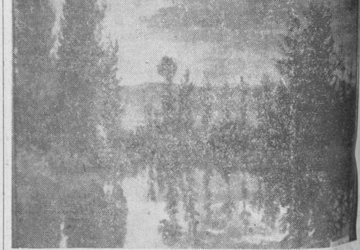
Otro magnífico cuadro titulado "Paisaje", de los que se presentaron en el Grupo Francisco Vitoria

Dado que la recaudación de la venta de las obras se destina a los refugiados católicos centroeurop... en nuestra Patria, se espera que la generosidad del público salmantino se haga patente, como ha venido sucediendo desde estos artistas del Centro de Europa expusieron sus obras.