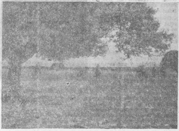
El traillero avanza rodeado de caballistas