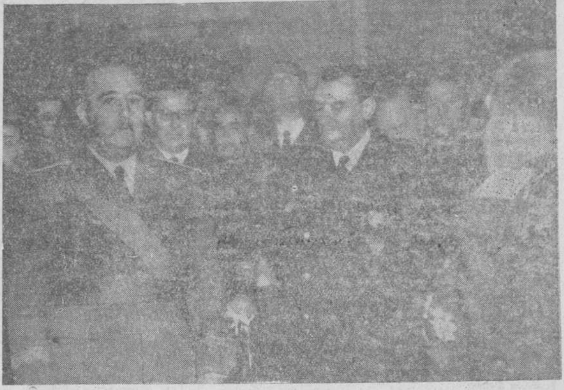
Con motivo de la Pascua Militar, visitaron el Jefe del Estado, en su residencia oficial, los generales, jefes y oficiales de los distintos Cuerpos. En la fotografía, el Caudillo escucha las palabras del ministro, teniente general Davila