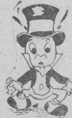
"Pepito Crillo", por Emilio García