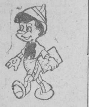
Pinocchio, por Rufino López