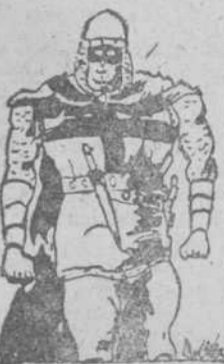
El guerrero del antifaz, por Ramón Masegosa