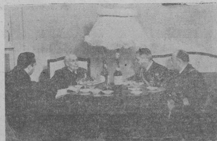
Una comisión presidida por el vicealmirante marqués de Valterra, ha visitado esta mañana al almirante Magaz para felicitarle las Pascuas y obsequiarle con un regalo.