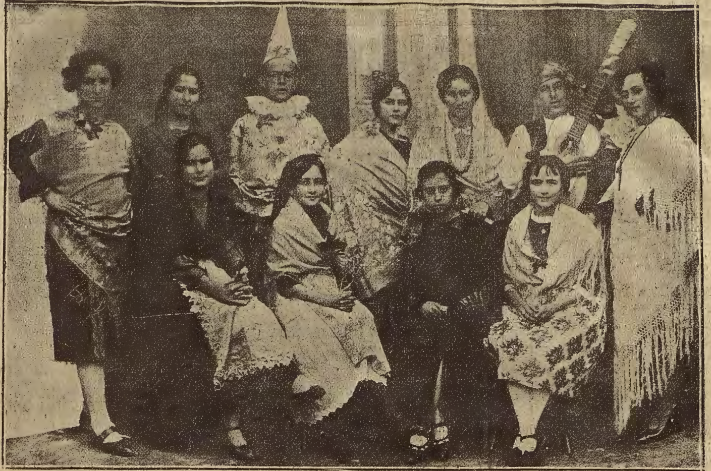
EL CARNAVAL EN MARIA DE HUERVA.—Disfraces que lucieron varios jóvenes de las mejores familias de la localidad