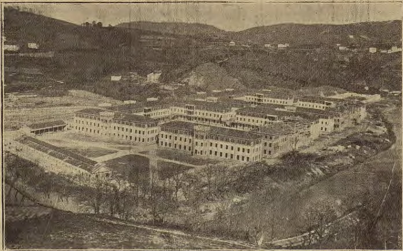
SAN SEBASTIAN.—Vista general de los nuevos cuarteles construidos en Loyola e inaugurados con asistencia del rey

Siglos después, de nuevo la raza ibérica, esparcida por Europa y América, se apresta a cumplir su misión. La providencia la guía. Para ello, la raza necesita un ideal que le una, cumplir en el siglo XX la misión que de-