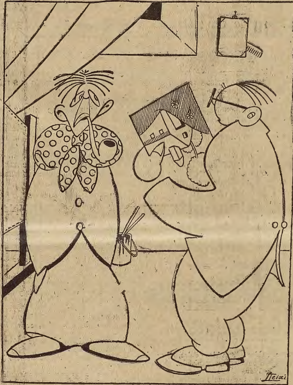
— ¡Chico, te felicito; estás hecho un artista!

La publicidad en LA VOZ DE ARAGON es la más conveniente para el industrial y el comerciante, porque este periódico es el más leído en Aragón, Navarra y Rioja.