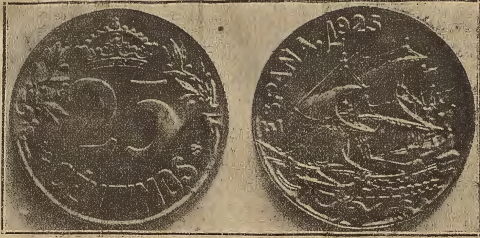
Anverso y reverso de la nueva moneda de cuproniquel, de veinticinco céntimos, que muy en breve será puesta en circulación en España.

Dice Lloyd George, en uno de los artículos en que se produce la alta mentalidad de su genio político, que «Alemania está dispuesta a consagrar con su firma la pérdida definitiva de Alsacia, Lorena y Malmédy, con tal de tener paz, y Francia, y Alemania están dispuestas a someterse al arbitraje hasta las cuestiones relativas al sacrosanto tratado de Versalles, con tal de que se les garantice la paz en sus