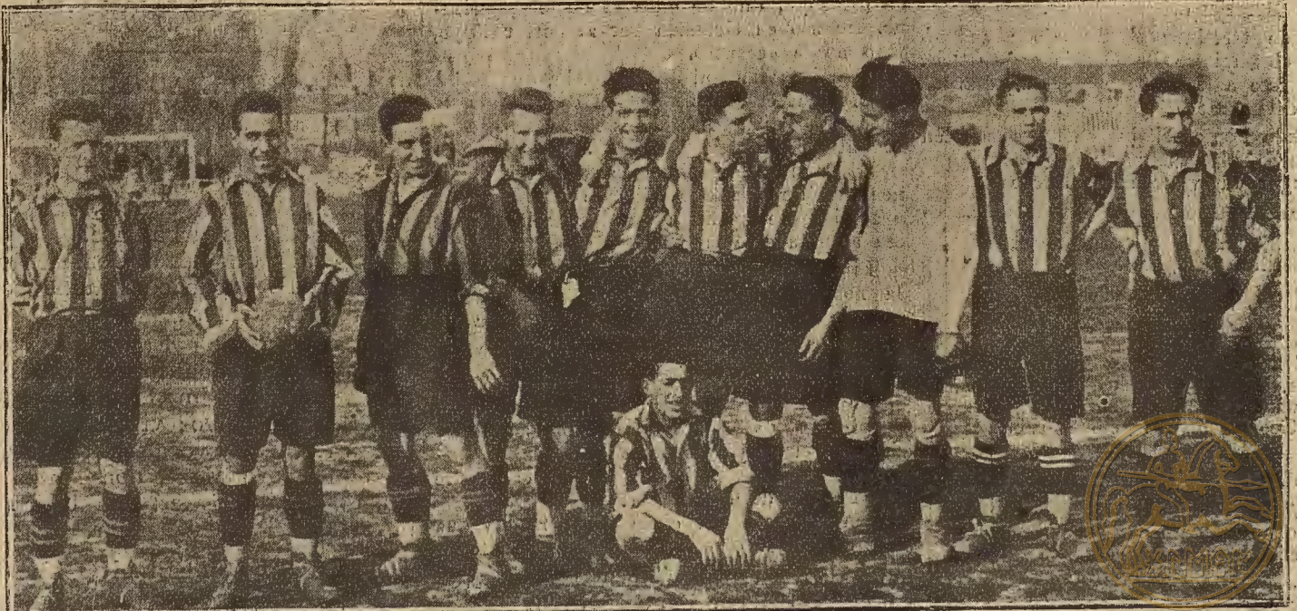
DEL PARTIDO DE FUTBOL DE AYER.—El equipo del Iberia S. C., que venció en partido amistoso al Aguila, por dos tantos a uno