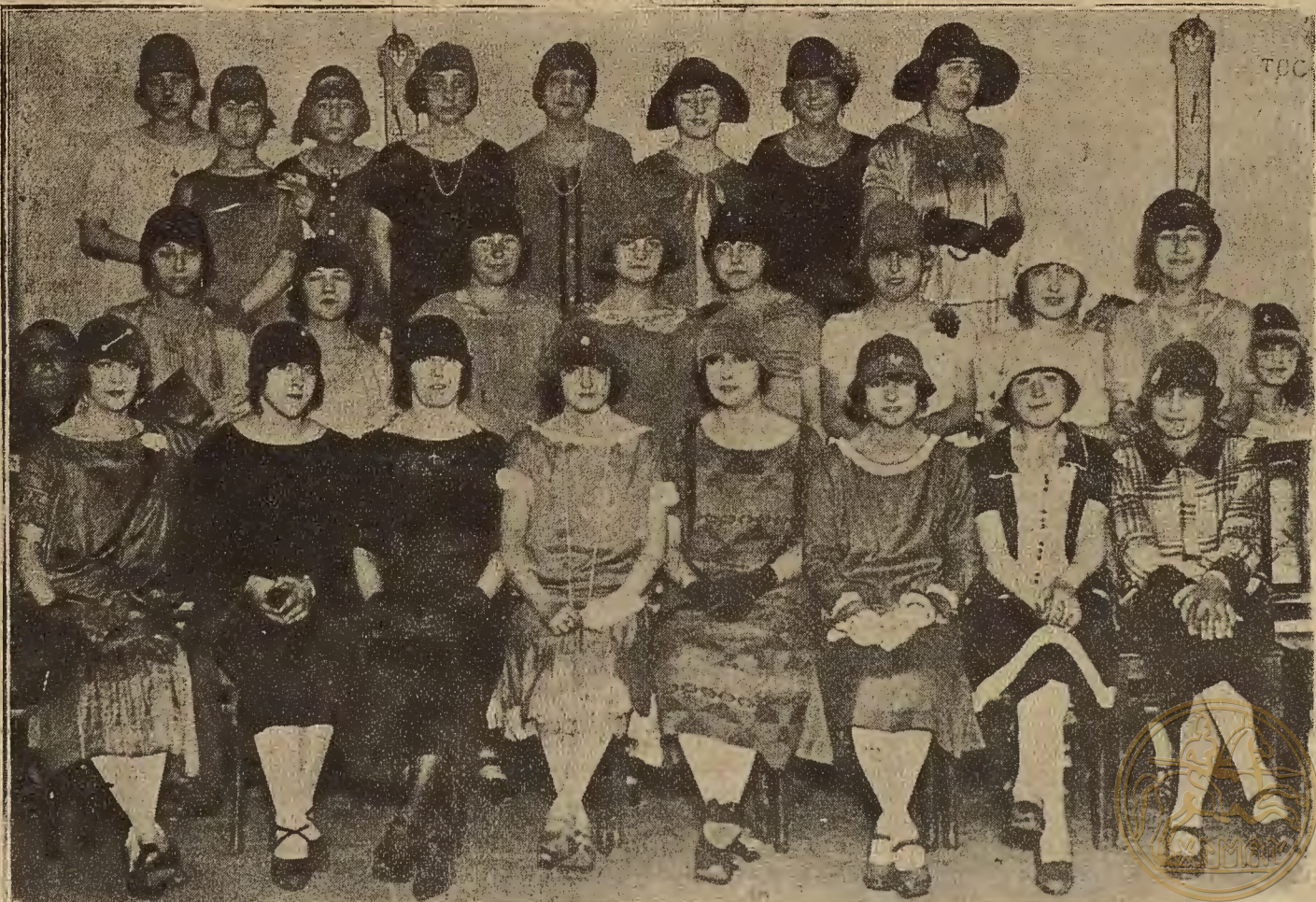
EL CARNAVAL EN ZARAGOZA.—Señoritas que asistieron al baile celebrado ayer en los salones del Circo.