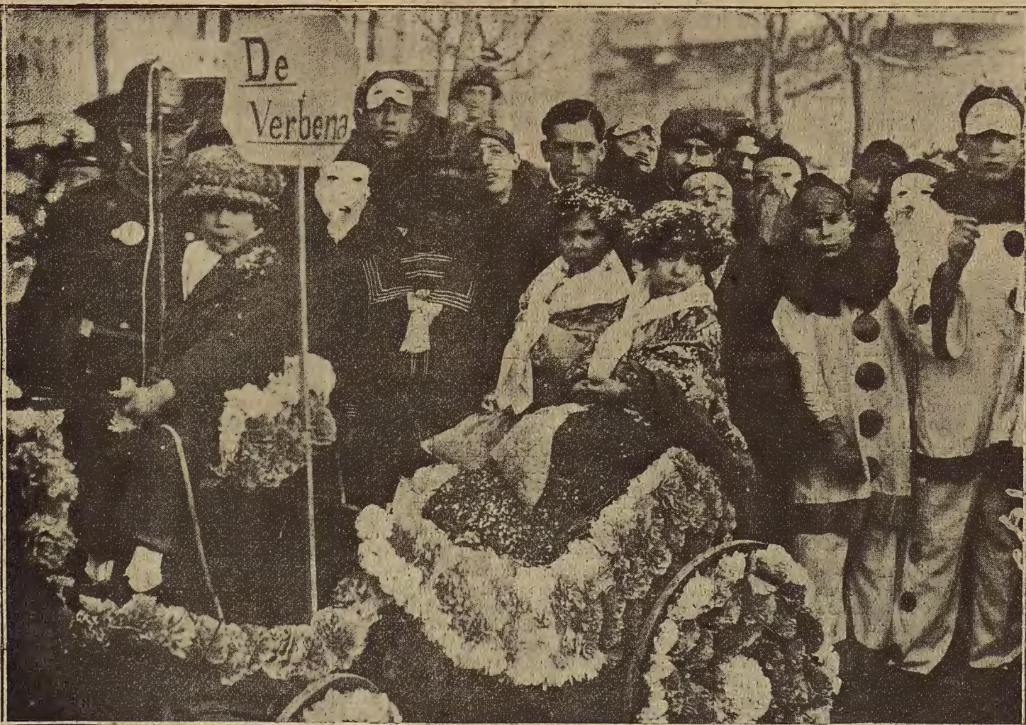
EL CARNAVAL EN MADRID.--Cohechito de niños «De verbena», que llamó mucho la atención

La lesionada fué llevada al Hospital clínico donde el médico de guardia, doctor Sancho, le apreció una herida contusa en la región picipital, calificada de pronóstico reservado. Quedó hospitalizada en la Facultad.