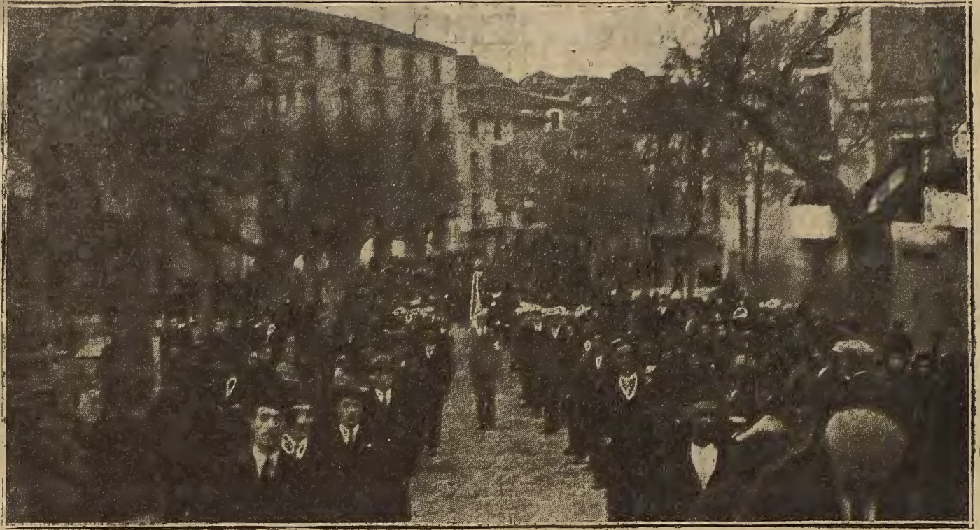
EN TARAZONA.—La manifestación popular dirigiéndose al Te-Deum que se celebró por el triunfo de los aviadores españoles.

Para informar a nuestros lectores de cuanto ocurre en Madrid, provincias y extranjero, celebramos varias conferencias telefónicas diarias con Madrid, Barcelona y San Sebastián.