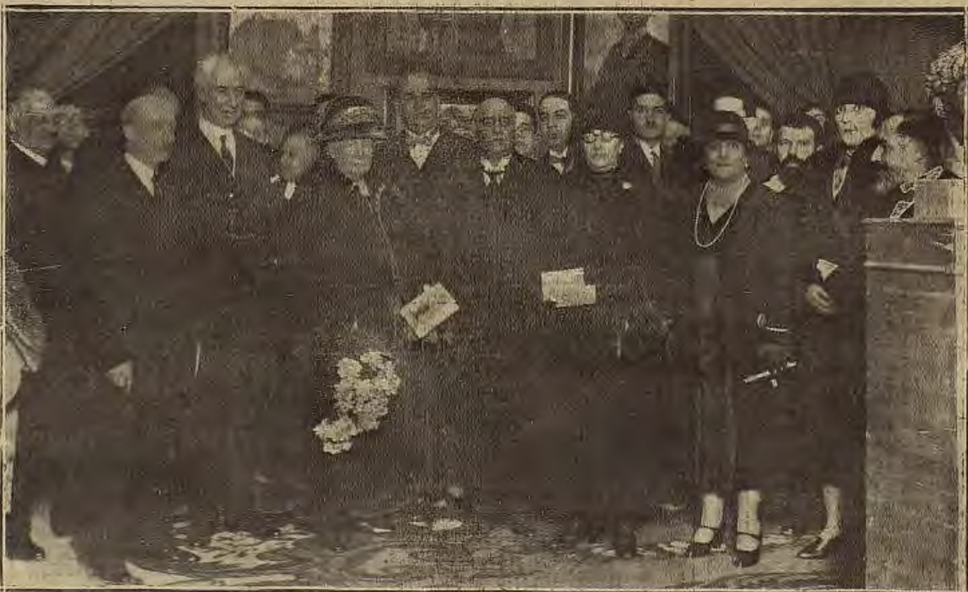
MADRID.—La infanta doña Isabel con el ministro de Instrucción Pública, embajadores de la Argentina y personalidades que asistieron al acto inaugural de la notable Exposición de Arte Argentino

De la fiesta de ayer, que nos pareció brevísima, así lo deducimos.