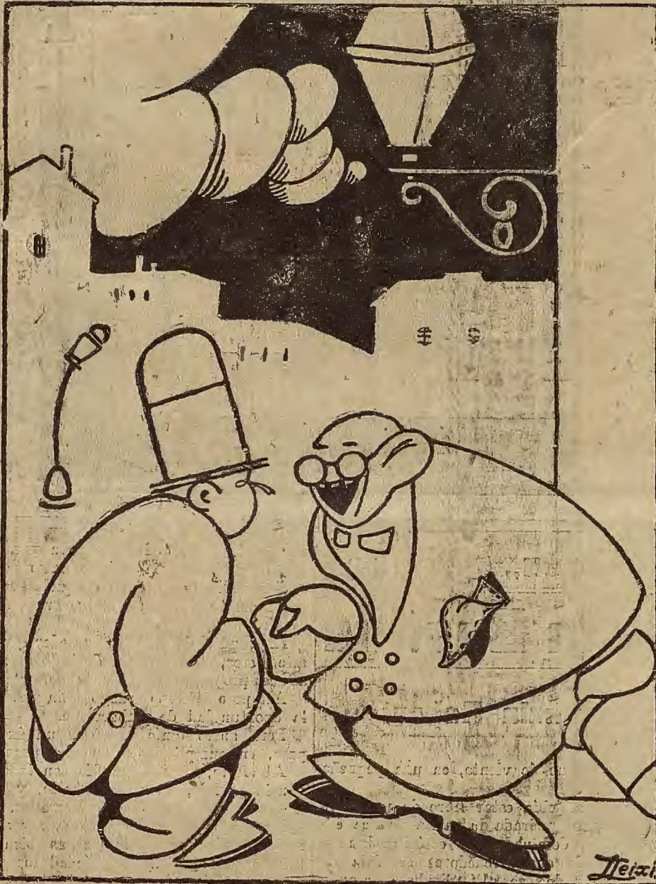
—¡Caramba, cuánto me alegro encontrarte! ¿Puedes prestarme cinco duros para celebrar el éxito del raid?

SE HA PUBLICADO UNA GUIA del empleado español. Es un libro muy interesante. No quiere decir esto que se trate de una novela al estilo de las de Díaz Canje, pongamos como honesto ejemplo de escritor interesante. Pero en la guía del empleado hemos hallado cosas de gran interés.