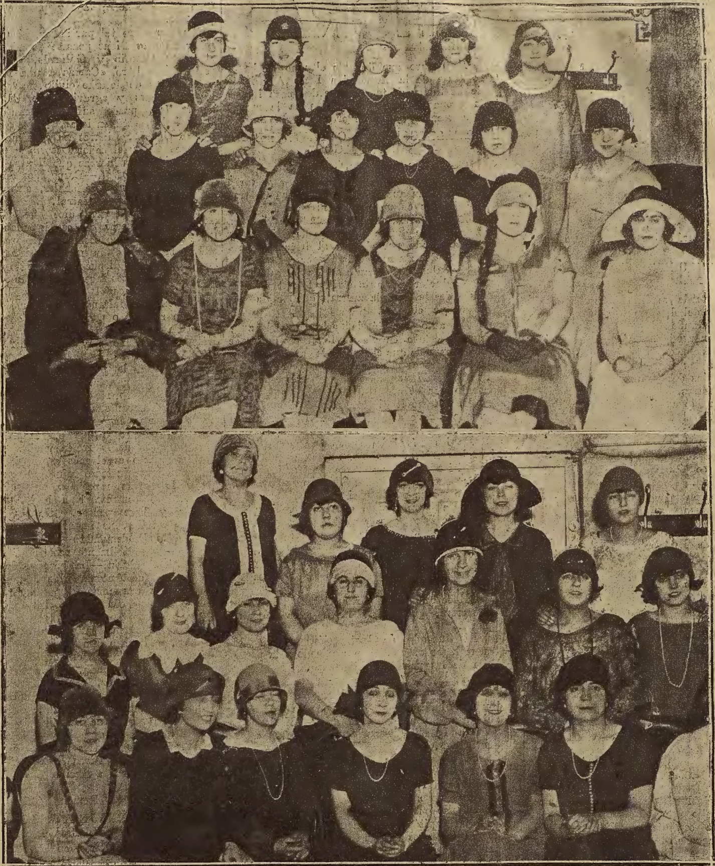
EL CARNAVAL EN ZARAGOZA.—Señoritas que asistieron al baile asalto celebrado ayer por la tarde en el teatro Principal