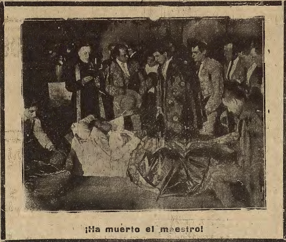
¡Ha muerto el maestro!