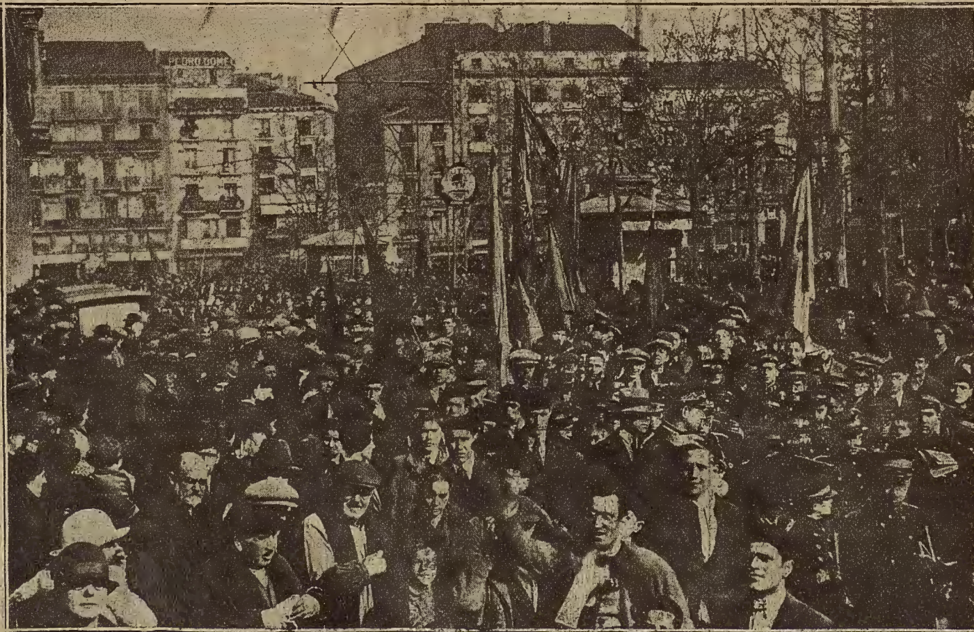
DE LA MANIFESTACION CELEBRADA AYER EN ZARAGOZA PARA CELEBRAR EL ARRIBO DEL «PLUS ULTRA» A BUENOS AIRES.—Momento de entrar la manifestación en el paseo de la Independencia.