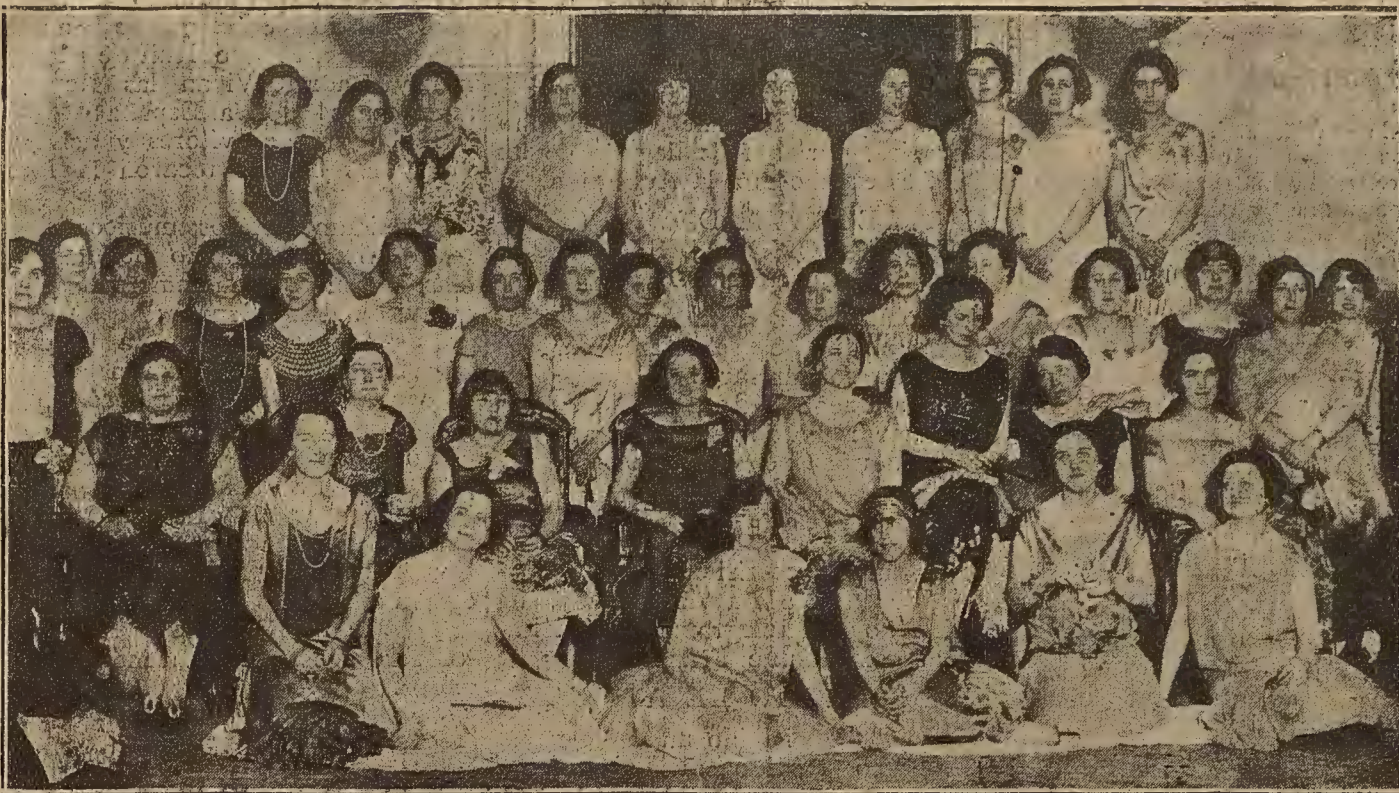
DE SOCIEDAD.—Señoras y señoritas que asistieron a la fiesta escocesa celebrada brillantemente en el Casino de Zaragoza