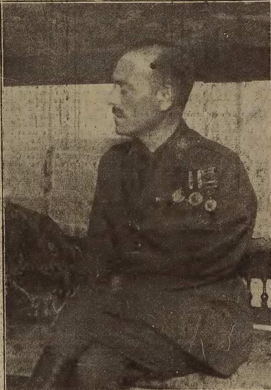
FIGURA DE ACTUALIDAD.--El coronel Millán Astray, que acaba de ser nombrado jefe del Tercio

El Paraguay, bajo Francia, ofrece el arquetipo, la esencia, el summum de un pueblo feliz: un puño fuerte y robusto que encarna bien el sentido de la autoridad y un rebaño de hombres sin necesidades, sin ambiciones y sin malas costumbres, que sepan cerrar las