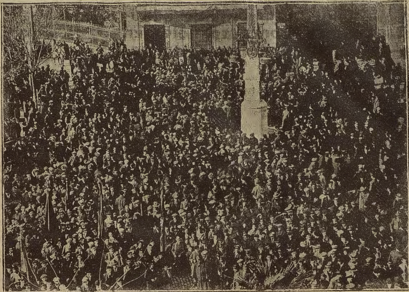
UN ASPECTO DE LA MANIFESTACION CELEBRADA AYER EN ZARAGOZA EN HONOR DE LOS AVIADORES ESPAÑOLES QUE HAN ATRAVESADO EL ATLANTICO.—Los manifestantes apinados frente al gobierno civil

Hizo resaltar la importancia de este vuelo intercontinental en sus variados aspectos, y explicó admirablemente la trascendencia que tiene la aproximación de España a las Repúblicas hermanas de allende los mares.