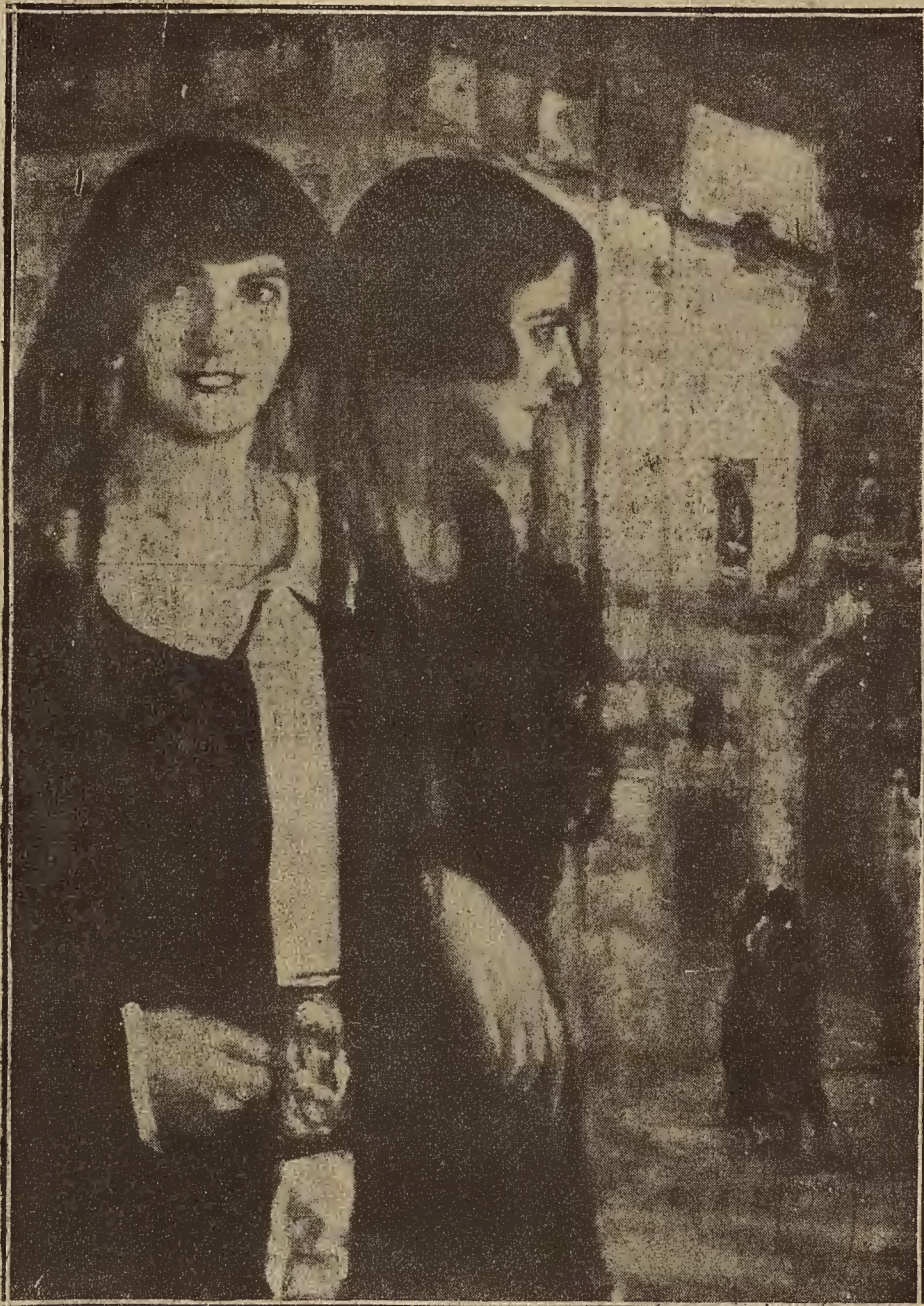
«Tempraneras», cuadro de Vicente Cobreros Uranga, que figura en la exposición abierta en el Centro Mercantil