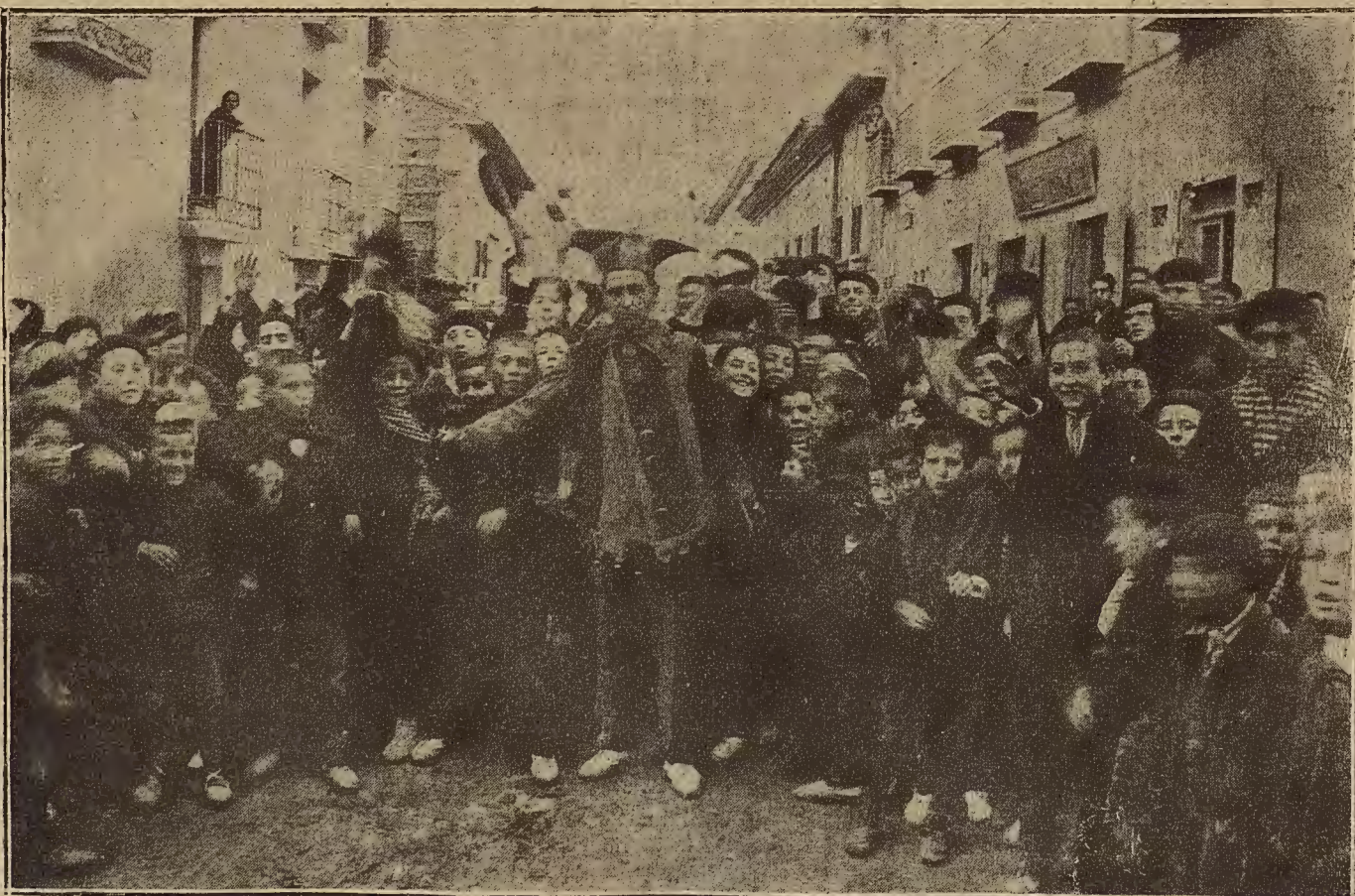
LAS FIESTAS DE SAN BLAS EN ATECA.—La tradicional fiesta de la máscara, o el terror de los chiquillos