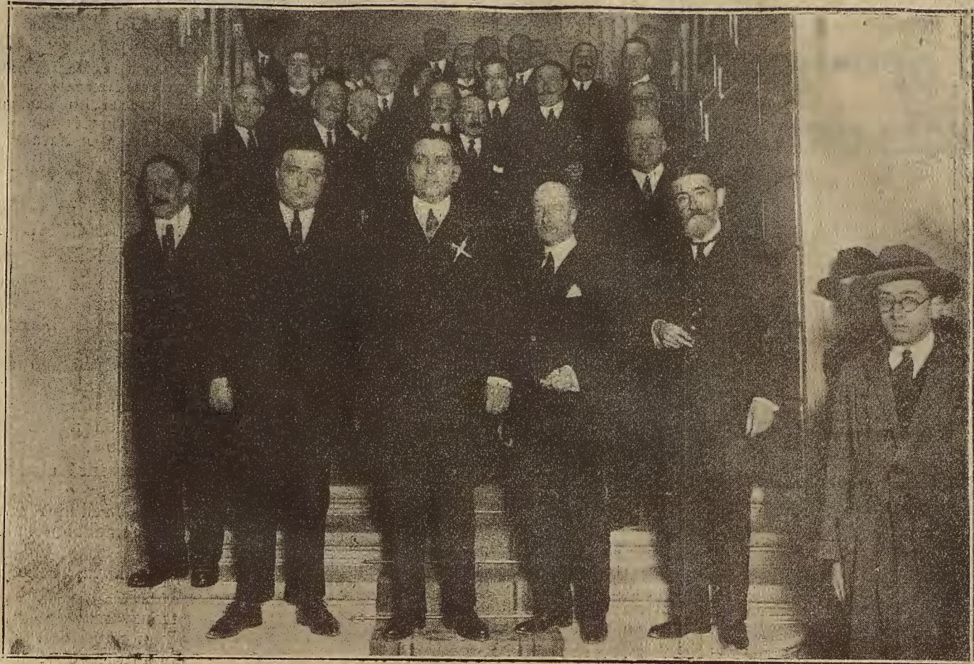
MADRID.—El ministro de Hacienda señor Calvo Sotelo (x) con sus compañeros los de Trabajo e Instrucción Pública y varios concurrentes a la conferencia dada por el primero en la Academia de Jurisprudencia para explicar el alcance de los reales decretos sobre régimen tributario

Holados, Bocadillos, Licoros, Chocolates, Repostería, Mariscos