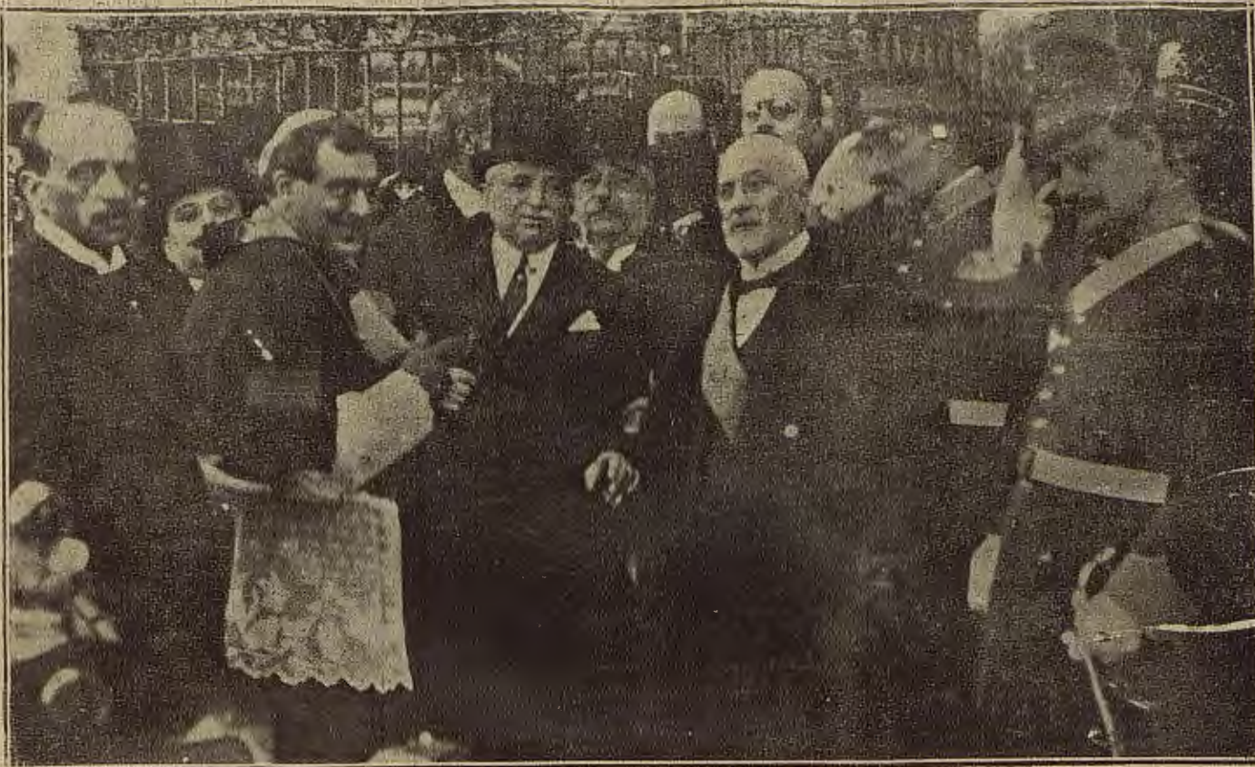
EL MINISTRO DE GRACIA Y JUSTICIA EN ZARAGOZA.—D. Galo Ponte, con el alcalde señor Cerezuela, al salir de la iglesia de Santa Engracia, después del funeral en sufragio de don Antonio Maura.

Estuvo el ministro muy deferente con los