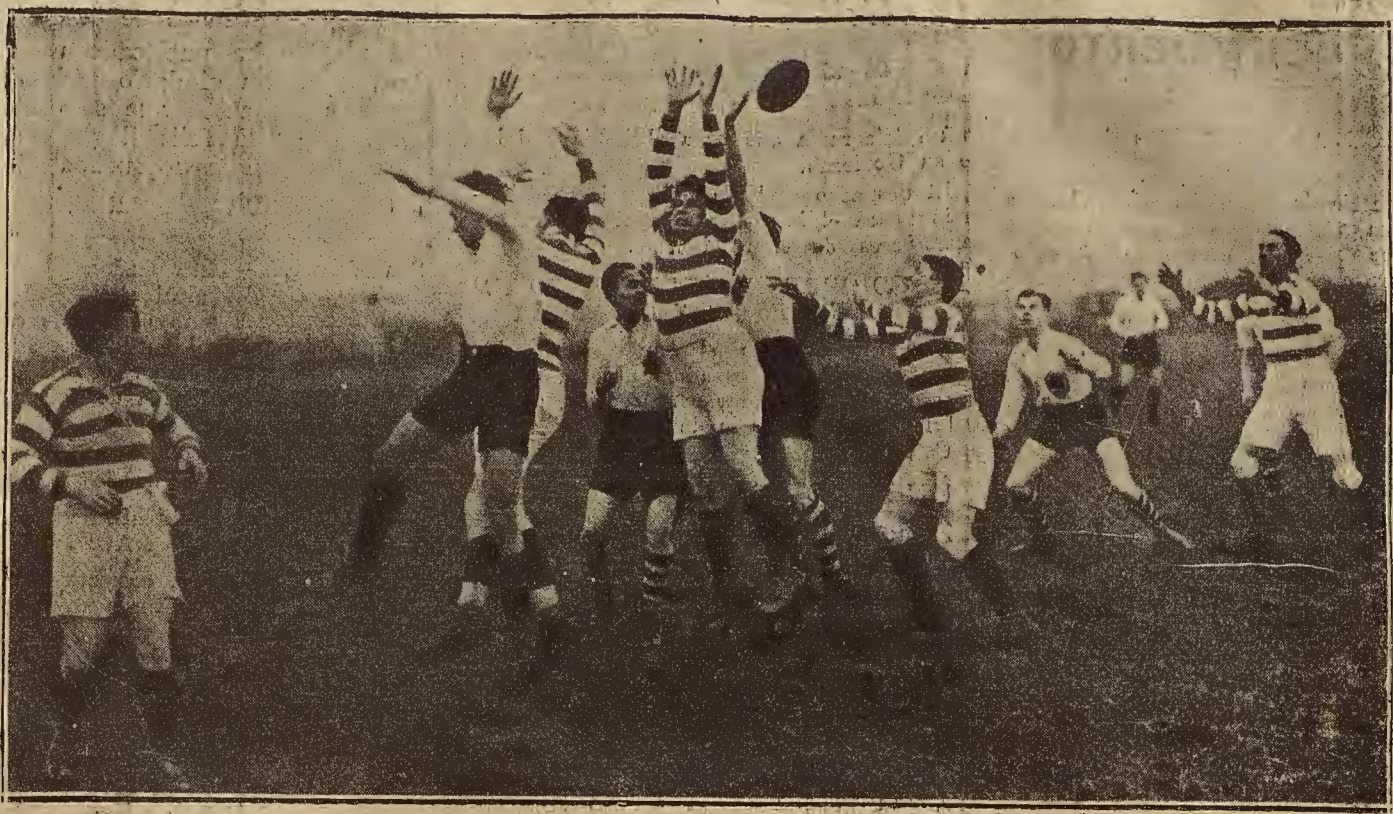
BERLIN: CAMPEONATO INTERNACIONAL DE RUGBY.—Un momento del partido jugado entre el Swisshen B. F. C. de Suiza y el equipo alemán Preussed und B. S. C. Komet