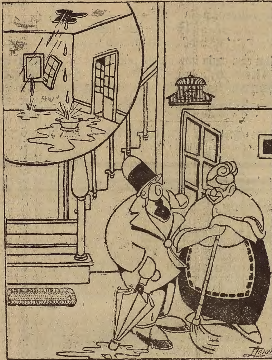
—Lo de menos es pagar treinta duros por el alquiler del piso, mientras haya agua abundante.

que a menudo se pierde un brazo o una pierna o se destroza la cara; pero esto ¿qué importa? Ha ganado el premio, ha sido proclamado invicto «campeón». Este es el gran placer, el placer supremo, y esto fundamenta la segunda causa que apunté en mi crónica anterior: «exceso de placeres fuera del matrimonio», como elemento de primer orden para avivar la crisis matrimonial.