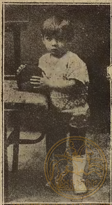
INSTITUTO DE ESTUDIOS AETORAGONESÉS Fernando Fajó Piazuelo