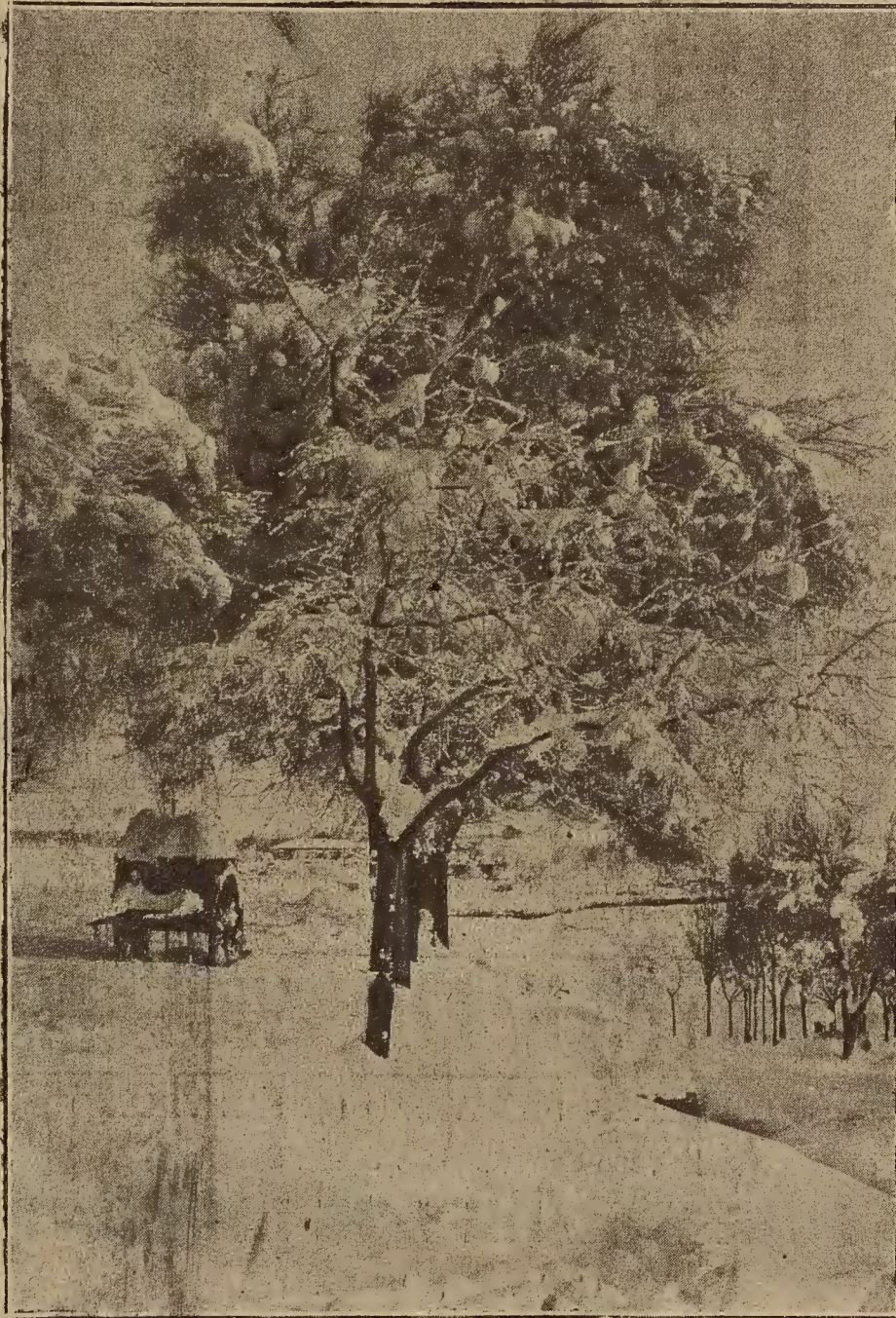
JACA.—PAISAJE BAJO LA NIEVE