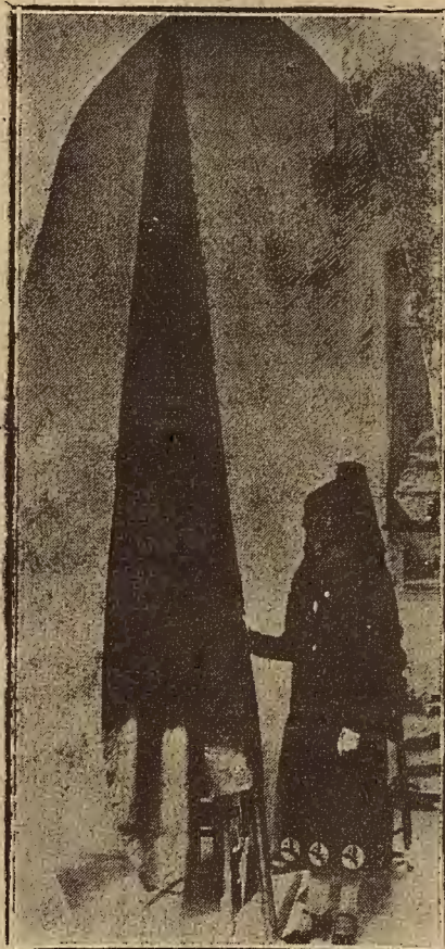
SEÑORITA ORIA PELEGRIN

Quedaron todos los comensales satisfechísimos, tanto del menú como del servicio.