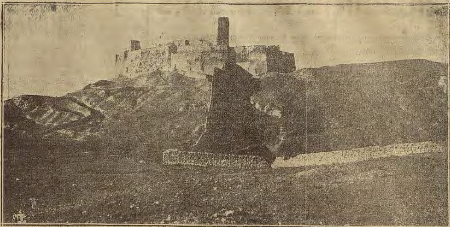
ARAGON PINTORESCO.—EL CASTILLO DE AYUD, EN CALATAYUD.

gimnasia, demostrando ante competentes tribunales ciertos conocimientos gimnásticos y educativos, obtendrán otros 45 días.