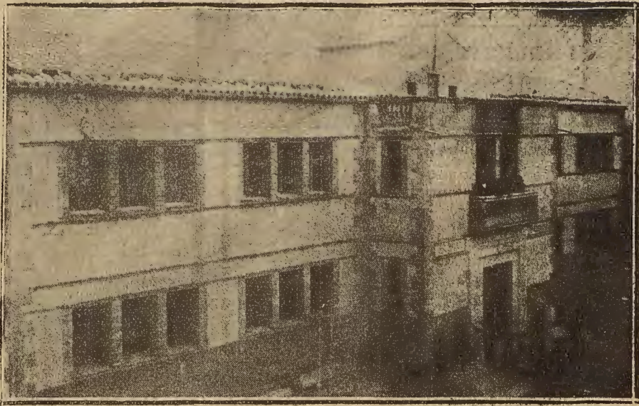
ESCUELAS NACIONALES DE MAZALEON, QUE FUERON INAUGURADAS EL DIA 22 DEL ACTUAL