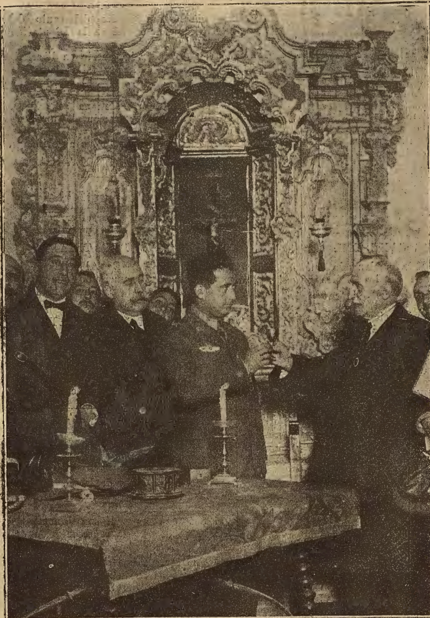
DEL RAID AEREO ESPAÑA-BUENOS AIRES: EN EL MONASTERIO DE LA RABIDA.—EL PRESIDENTE DE LA SOCIEDAD COLOMBINA ENTREGA AL COMANDANTE FRANCO UNA COPA DE ORO DESTINADA AL PRESIDENTE DE LA REPUBLICA ARGENTINA, Sr. ALVEAR