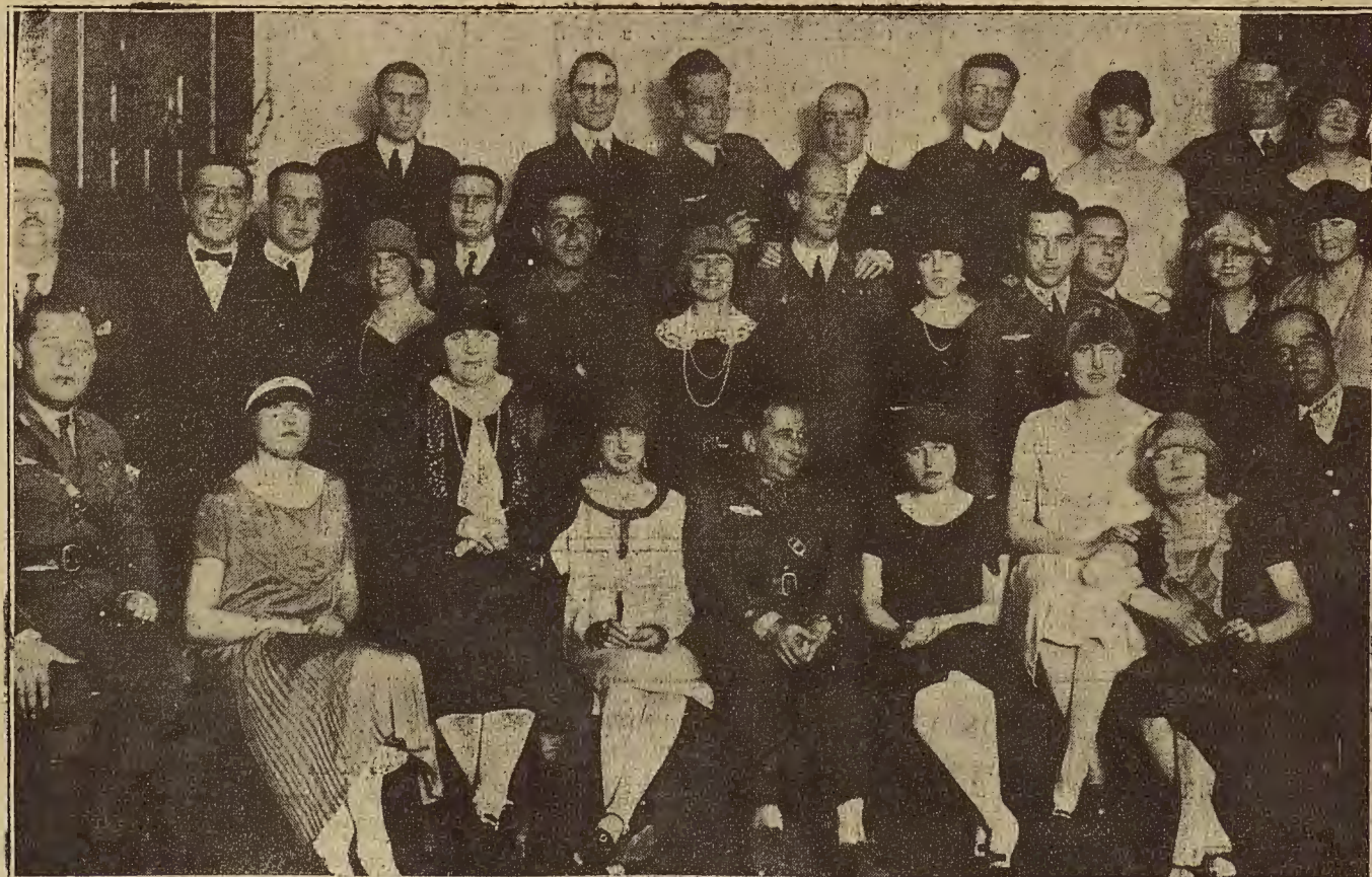
DEL RAID AEREO ESPAÑA-BUENOS AIRES: HUELVA.—EL COMANDANTE FRANCO Y DEMAS AVIADORES CON LAS SEÑORITAS Y PERSONALIDADES HUBENSES QUE ASISTIERON AL TE CON QUE FUERON AGASAJADOS EN EL CASINO DE HUELVA.