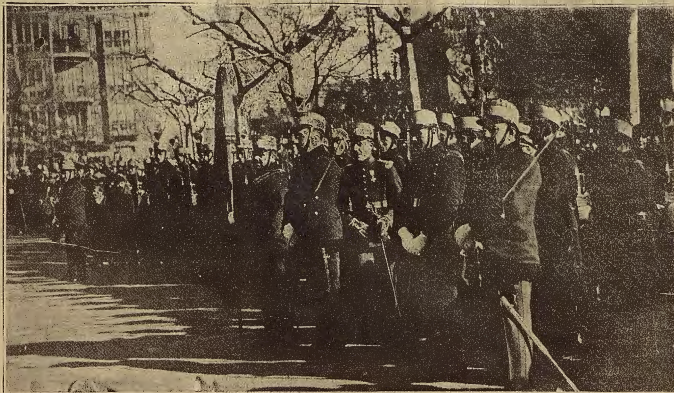
DE LA RECEPCIÓN DE AYER EN CAPITANÍA GENERAL. — EL PIQUETE ENCARGADO DE RENDIR HONORES

La discusión fué motivada sobre mejor derecho a unos pastos. San Higinio fué agredido por sus contendientes, resultando con una pequeña lesión en la espalda, producida con