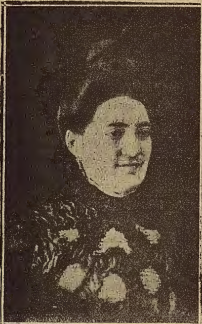
UN CRIMEN MISTERIOSO EN BARCELONA

Queréis hacer negocio. Regateáis. Os repite una misma cifra. Sonríe como puede sonreír una careta... Al fin cede. Tenéis en vuestro poder el collar