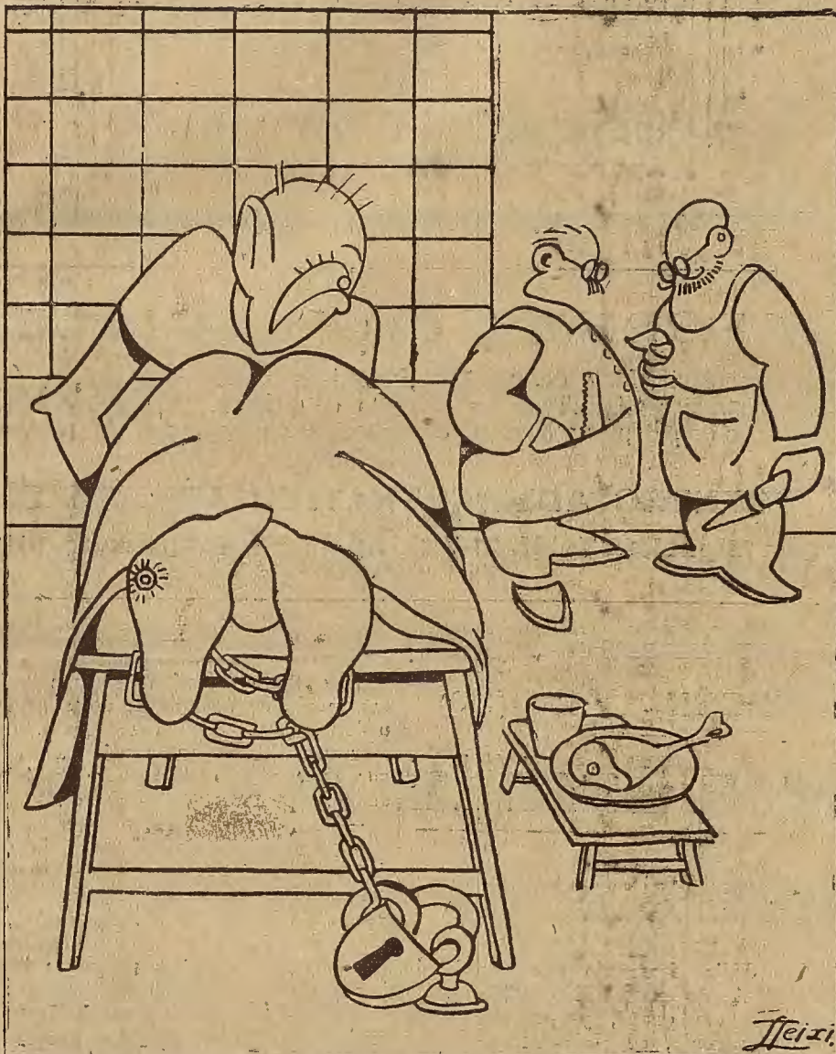
ANTE TAL DECISION, NO VEO OTRO REMEDIO