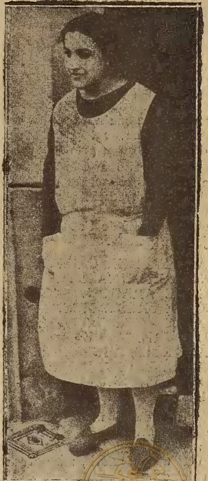
UN CRIMEN MISTERIOSO EN BARCELONA

He aquí una de las misteriosas sectas que la inmensa colmena que es Nueva York, mantiene en su seno.