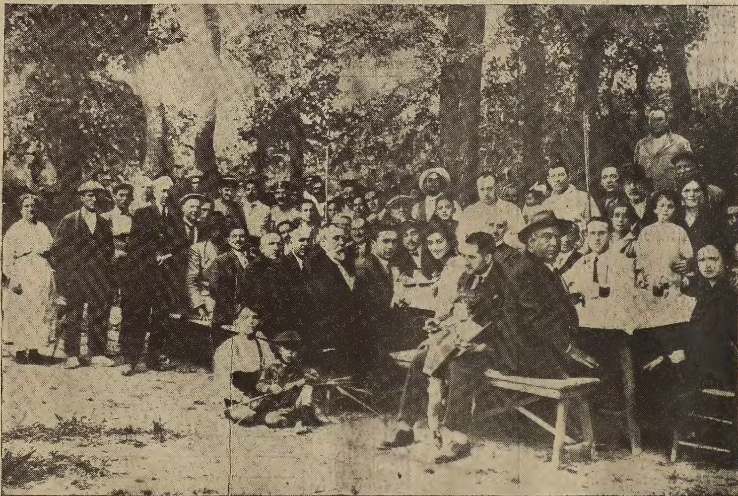
FIESTA FESCADERIL CELEBRADA EL DOMINGO A ORILLAS DEL EBRO. - Comida que se sirvió en la plazuela de "Las Peñetas".

Enseguida se bañan con huevo y se meten en un horno algo caliente, y cuando estén dorados y esponjados se sacan, debiéndose comer en seguida, pues pierden todo el mérito si se vuelven a calentar. El mariscal Enrique de Richelieu decía que para comer a gusto estos pastelillos era necesario que cada comensal llevase un horno en el bolsillo. A nuestro gran poeta don José Zorrilla le gustaban tanto que frecuentaba mucho, en busca de ellos, una vieja pastelería de la calle de Mesón de Paredes.