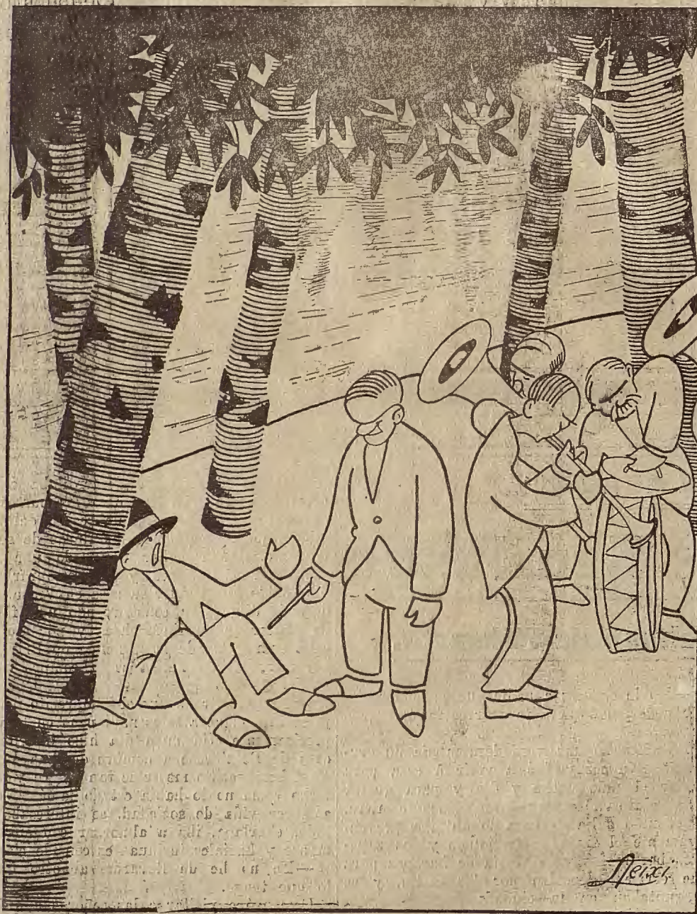
PREPARANDO EL PROGRAMA DE FIESTAS. «Esto va bien! Sobre todo, mucho ruido aunque haya pocas nueces.

2.º Que los niños y niñas de diez a catorce años podrán dedicarse a la venta ambulante, siempre que obtengan de la Junta de protección a la infancia, la oportuna autorización, para lo que serán provistos de carnés de identificación con la fotografía del interesado, y aun en este caso la venta se hará fuera de las horas escolares, desde las siete a las veintiuna horas en los meses