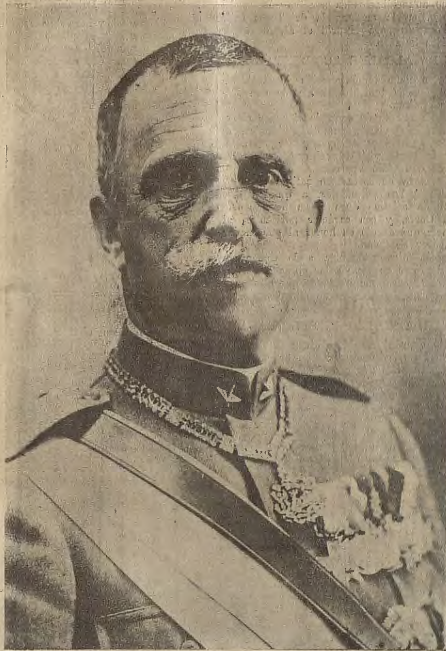
FIGURA DE ACTUALIDAD

¿Por qué no le imité—de ahí nace mi envidia—en lo del apartamiento? A estas horas podría ser yo incluso un respetable canónigo. Con mi carác-