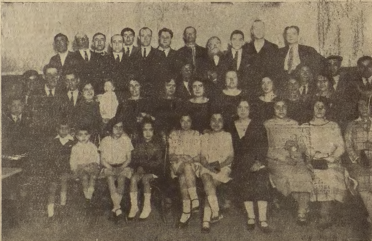
Grupo de concurrentes a la fiesta celebrada en el círculo "Unión de Cazadores y Pescadores de Zaragoza."

El plazo de entrega lo determinará el indicio técnico y el importe de los anuncios publicados en la Prensa local serán de cuenta del adjudicatario.