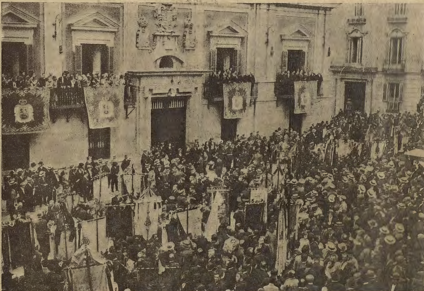
ACERD.—Los coros Clavé, de Cataluña, cantando ante el Ayuntamiento de la Corte