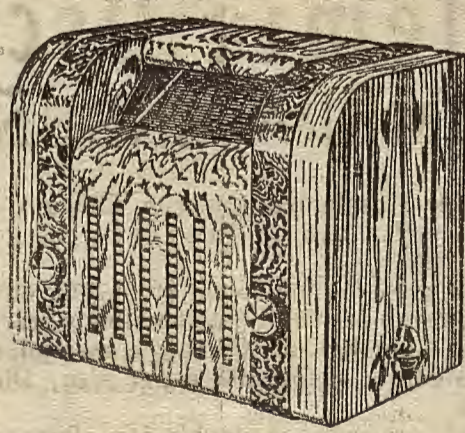
Gran Super 65; Ptas. 1.350