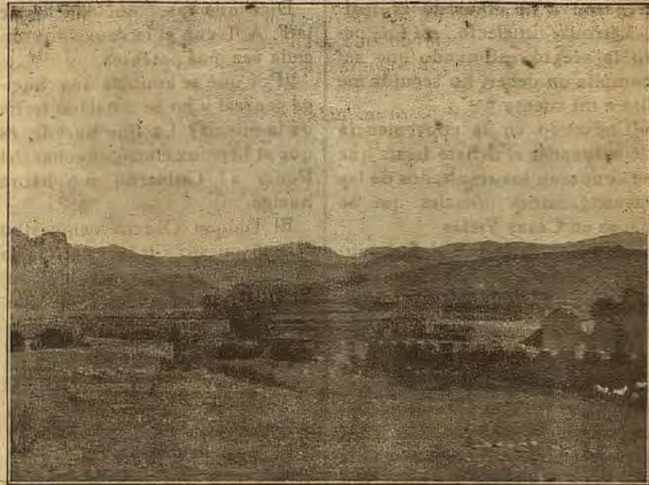
AINSA. — Restos de muralla

Pero el rey moro, que le está oyendo, replica: «¿Qué es eso de tuyo? — Tuyo será un cuerno. — Porque mía es la corona — Y mía es todo el Reino.»