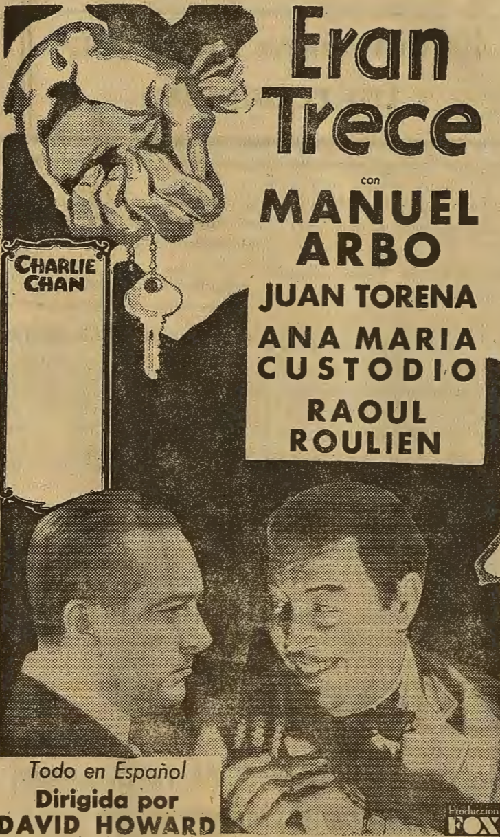
CHARLIE CHAN en la película más intrigante del año

Hoy, jueves, 14 de Abril de 1932 ESTRENO de la colosal superproducción