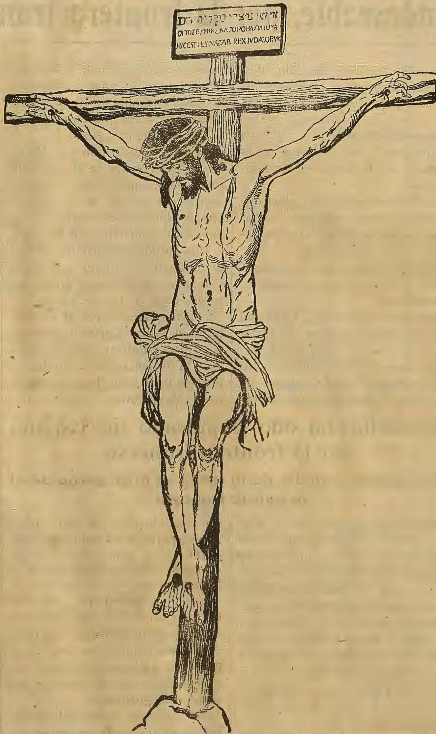
«Padre: en tus manos encomiendo mi espíritu»

La ingratitude humana ha tenido este remate... Cristo, en la Cruz, acaba de expirar... Martínez Montañés, el notable imaginero, ha plasmado este momento en la talla que se conserva en la sacristía de la Catedral de Sevilla y que reproduce este cliché.