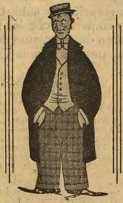
Hajo esta cara tan triste en que se me ve sufrir, siempre suele haber un chiste para hacerle sonreír.