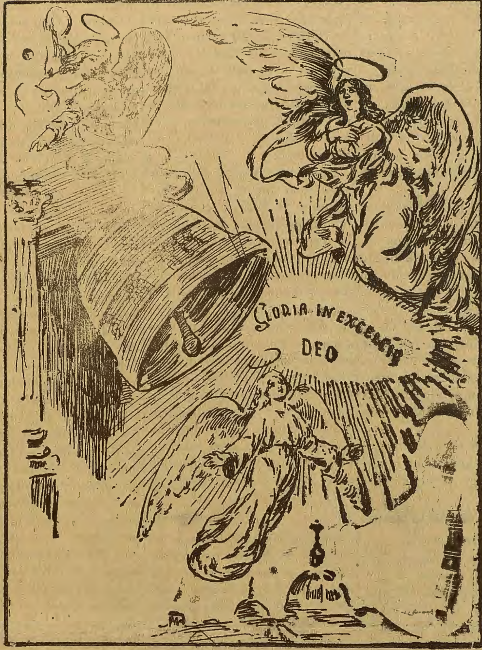
Pintura mural de la escuela italiana existente en Roma

veces advertida y observada: el afán en los Poderes públicos de rendir tributo a la justicia, persiguiendo sin tregua ni descanso a los malvados y criminales.