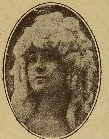
PAQUITA ALCARAZ Estrella de la canción