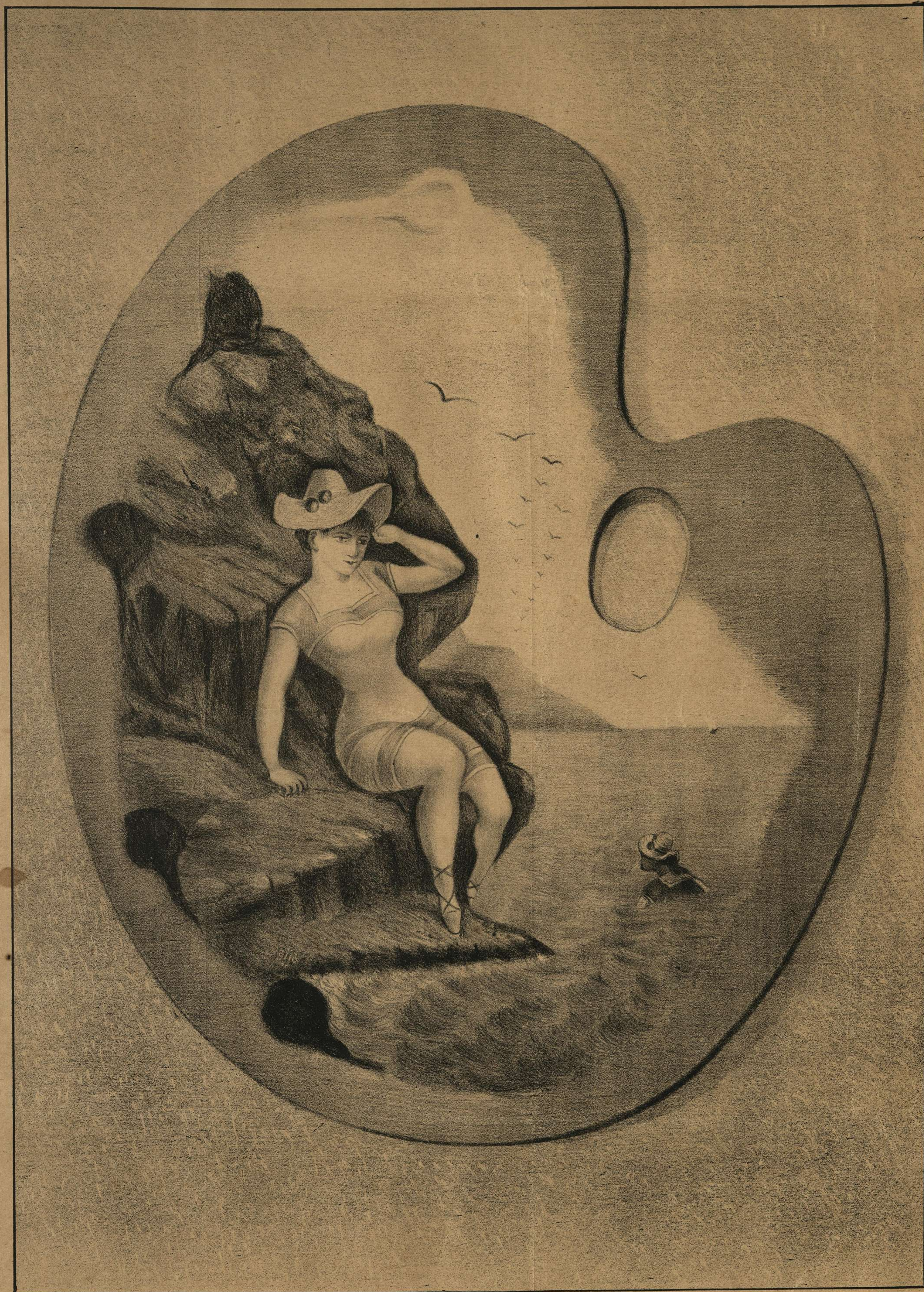
BAÑOS DE MAR.