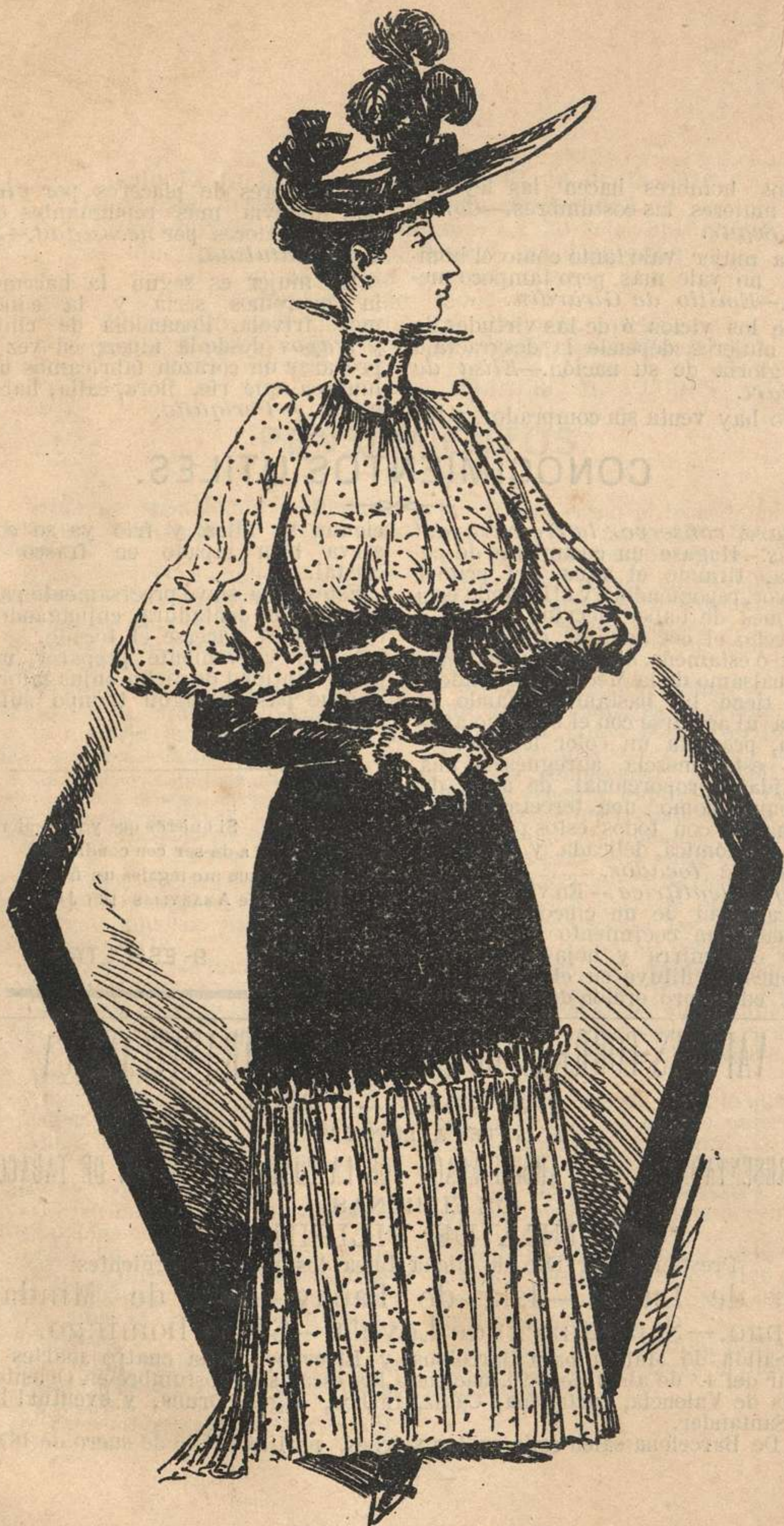
PESCANDO SIN CAÑA