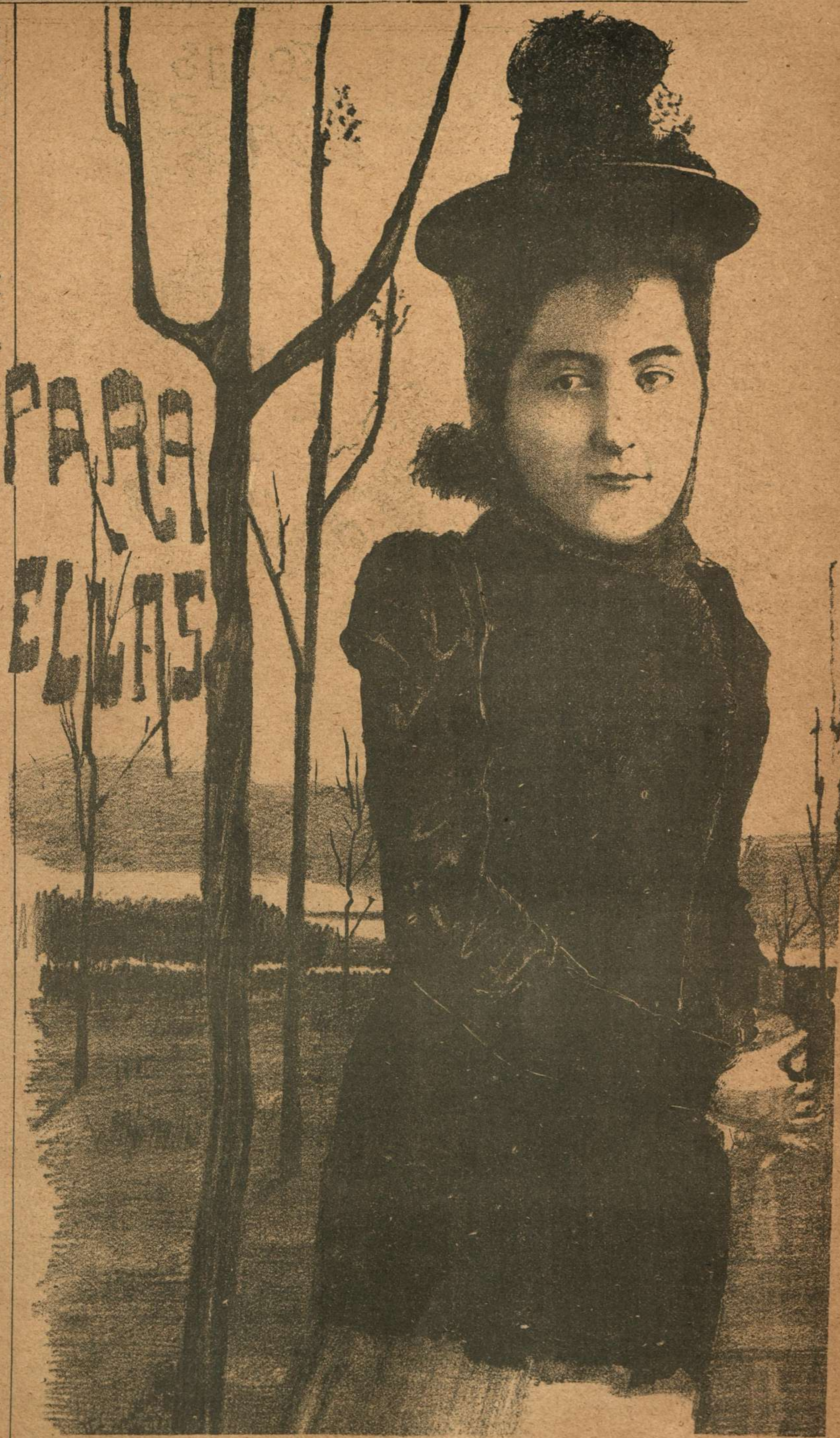
RAYO DE LUZ

En la calma fría de la gran tarde de otoño resonaba el golpeteo trepidante de cien coches que desde el Paso se derraman cubriendo la alegre calle Agraciada.