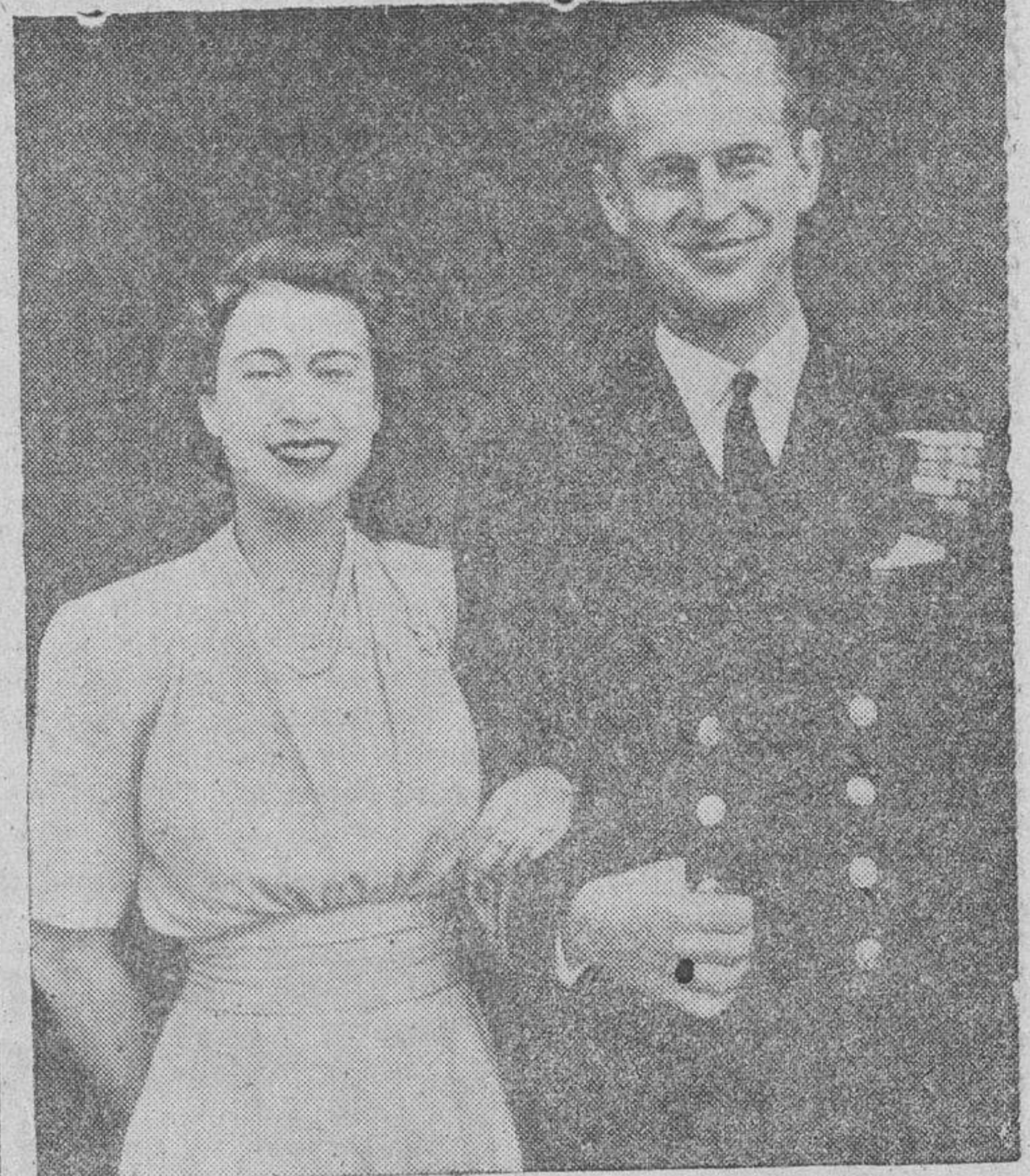
Los novios, camino de la abadía.

Caminaron unos cien metros con paso lento sobre una alfombra roja hasta el crucero. La novia lucía una magnífica creación de satén con incrustaciones de sutaché y perlas. El crucero tenía forma de corazón, con mangas largas y cchidas. Hasta la cintura, el vestido se ajustaba al cuerpo; la falda, larga, llegaba hasta el suelo, adornada con guirnalda de rosas blancas. La cola se componía de tres telas de tul, de cuatro metros y medio de longitud, sujetas a los hombros. El velo de seda dejaba la cara libre al sujetarse con una diadema de perlas y diamantes. (Continúa en cuarta plana.)