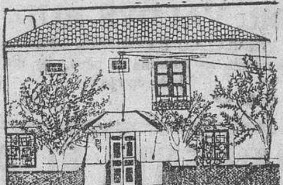
«Mi casa», por Pilarita Benito, de Carpio de Azaba