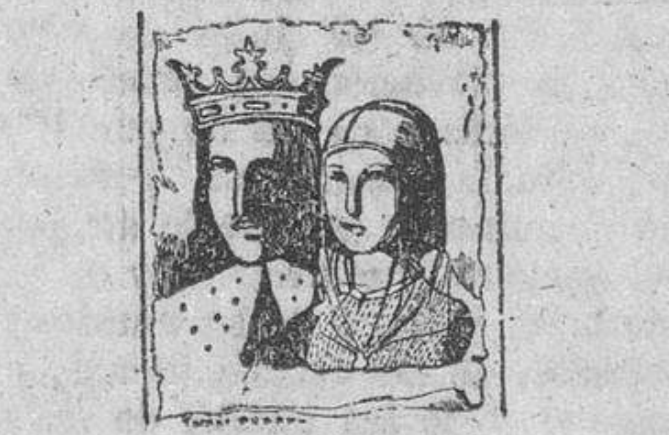
«Los Reyes Católicos», por Tomás Pérez