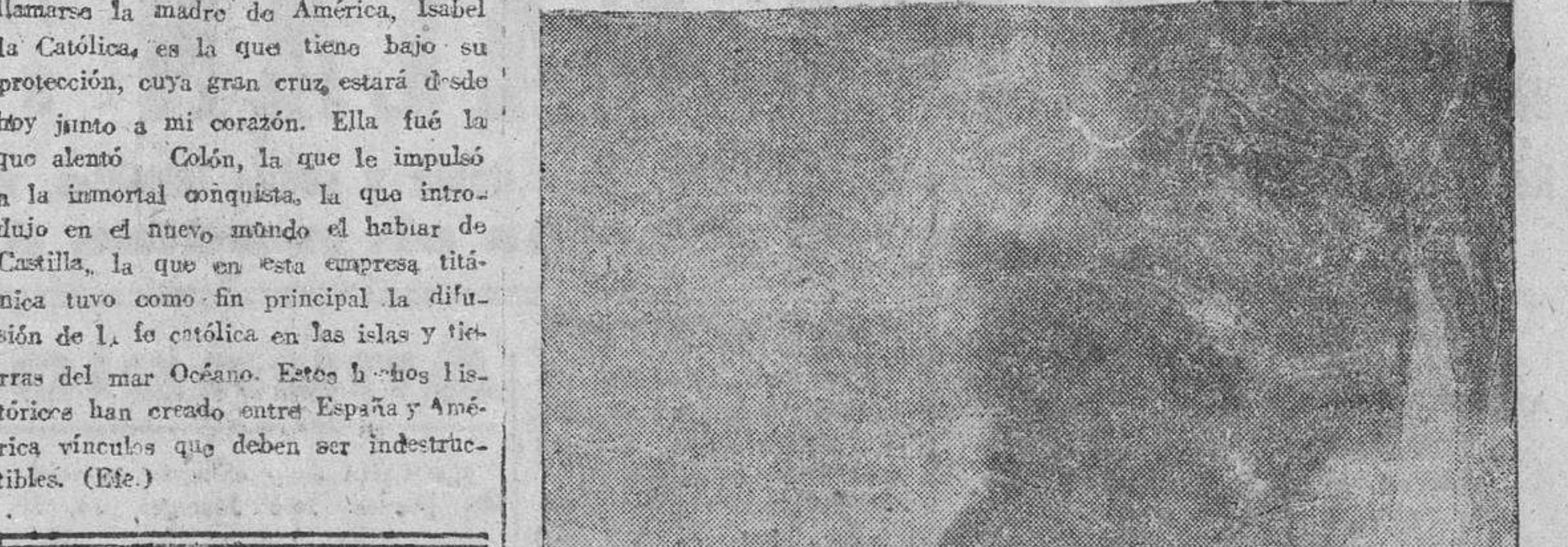
El barco mercante noruego «Ocean Liberty», cuya carga hizo explosión en el puerto de Brest, produciendo numerosas víctimas e importantes daños en las casas cercanas al puerto, aparece en la fotografía cuando se trata de sacar el navío de la dársena, en pleno incendio.