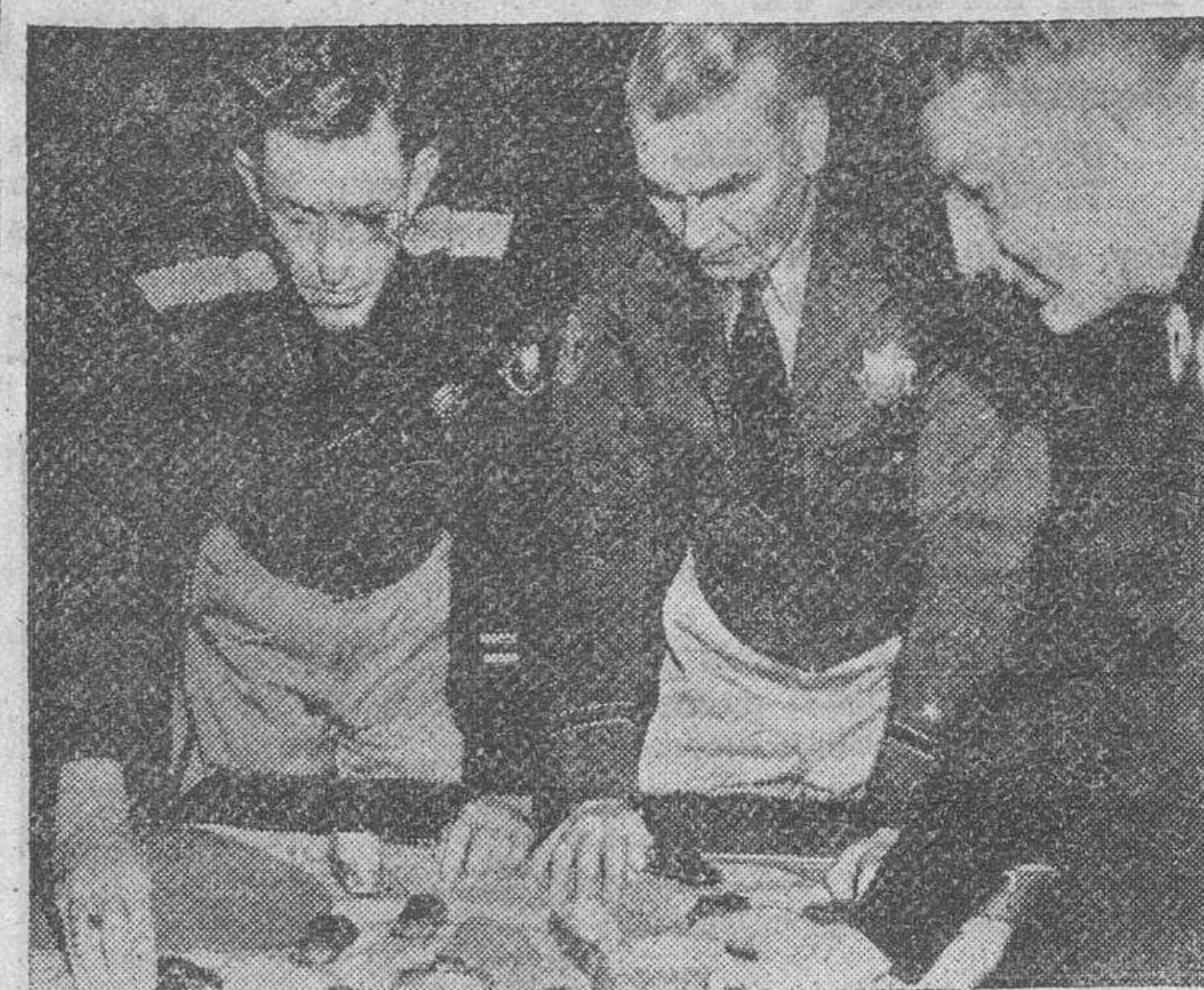
Tres oficiales que asisten a los cursos del Instituto, resucitan teóricamente, con modelos de coches, un complicado problema del tráfico en una carretera

Es un hecho que cada vez resucitan más complicados los problemas del tráfico en todos los países. La velocidad requiere constantemente más espacio vital y la ley de la impenetrabilidad de los cuerpos obliga a buscar medidas preventivas.