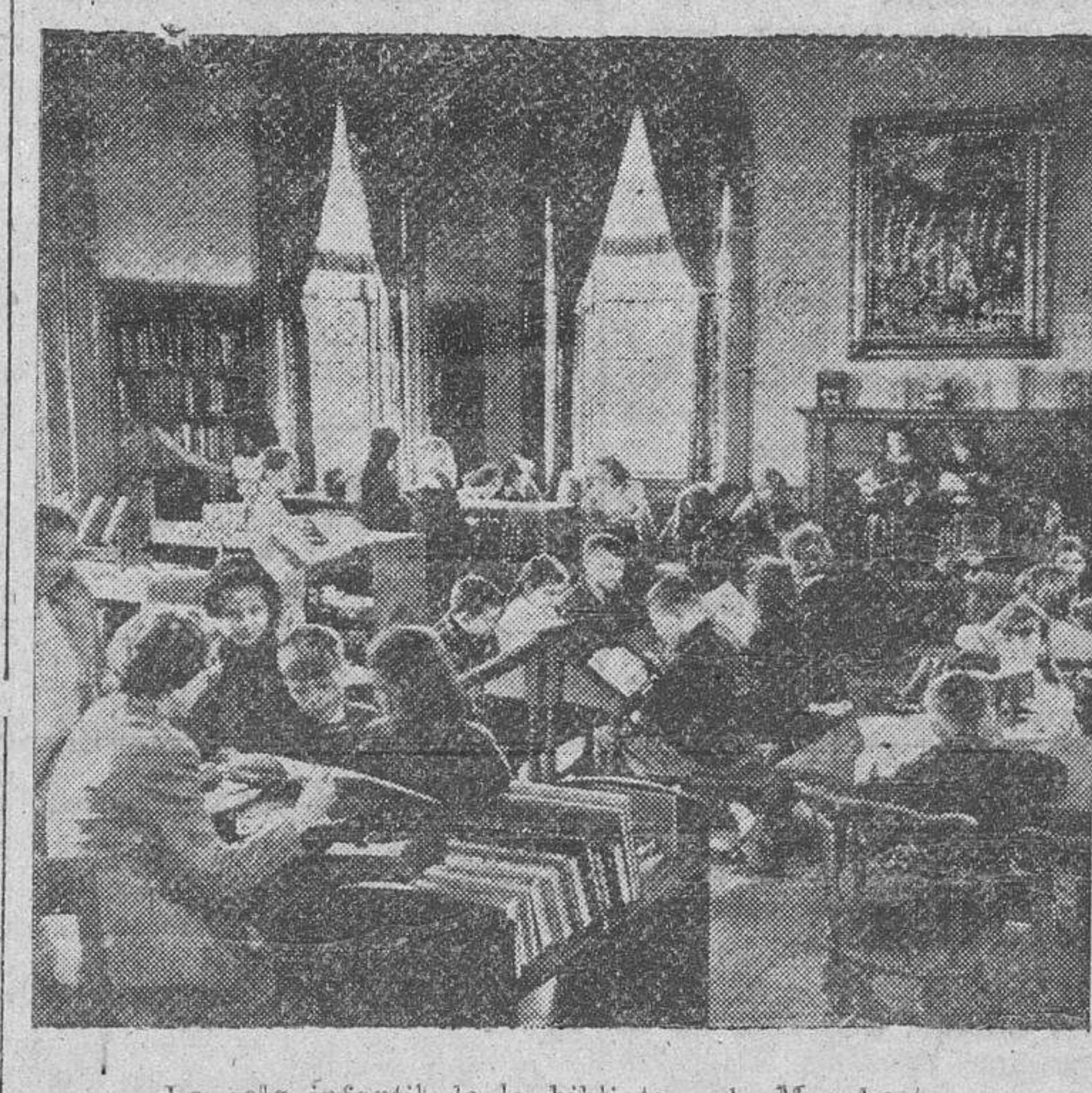
La sala infantil de la biblioteca de Manchester