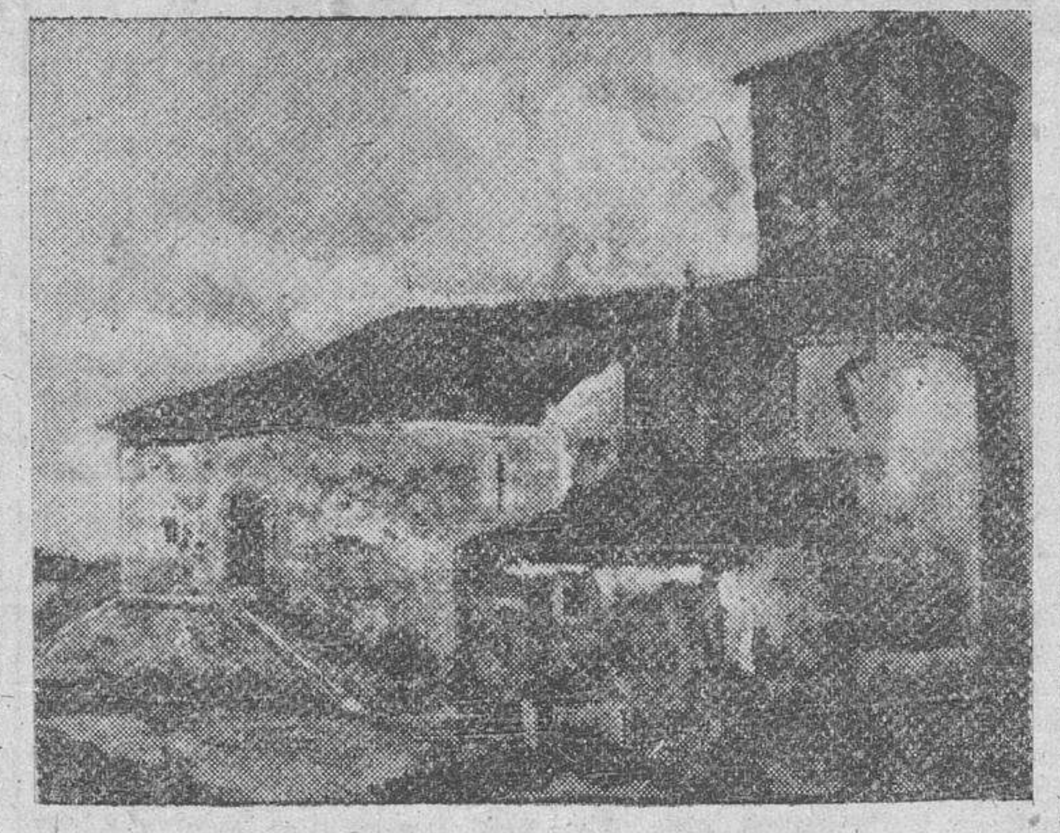
"Iglesia de Santiago" (Béjar), óleo de Garrido Sánchez