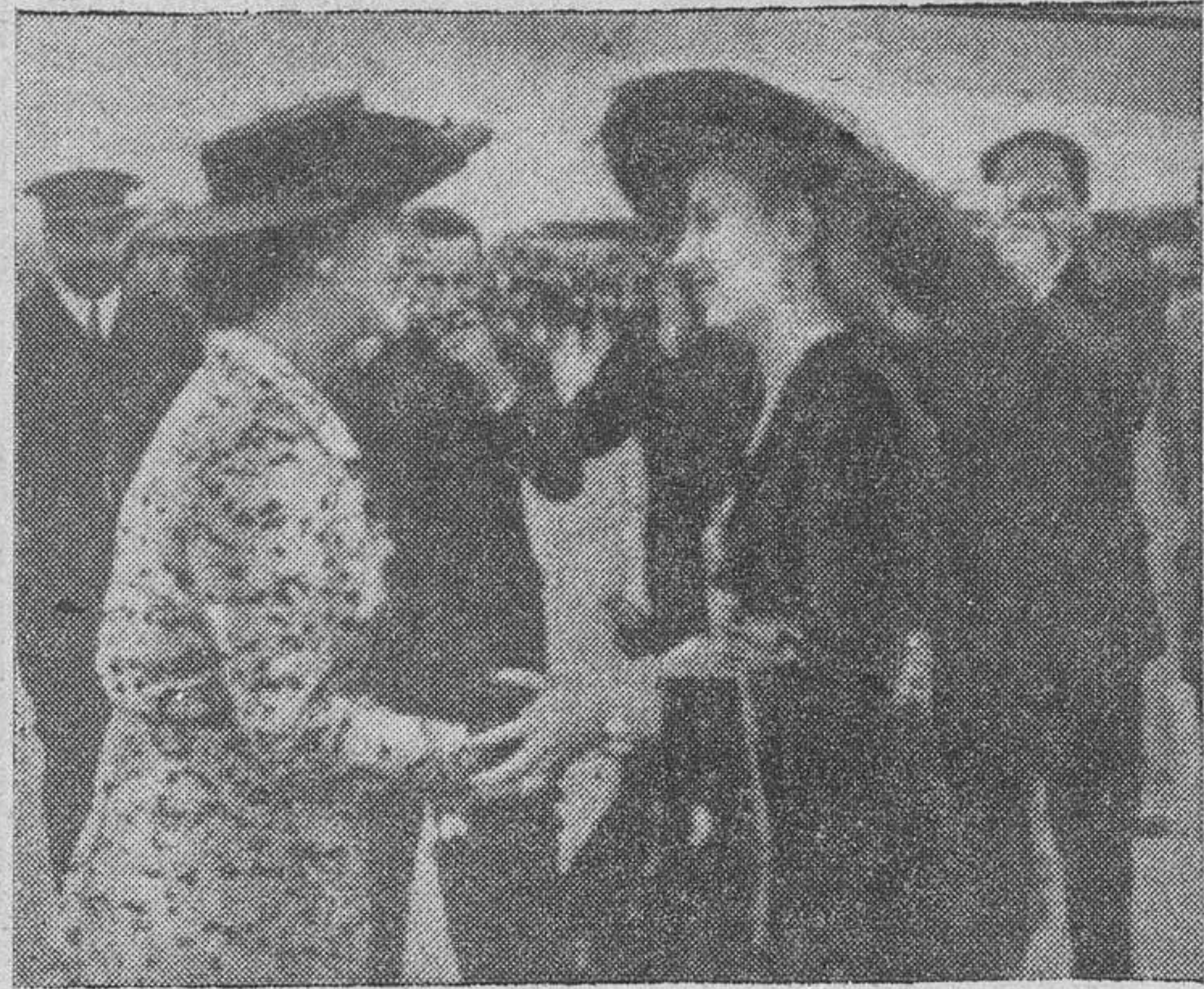
La esposa del Jefe del Estado, que llegó a Barcelona, con su hija Carmen, para acompañar a doña Eva Duarte en los últimos días de su estancia en nuestro país, recibe a ésta al descender del avión en que hizo su viaje desde Zaragoza.

El vecindario de Prat de Llobregat tributó cálidos aplausos.