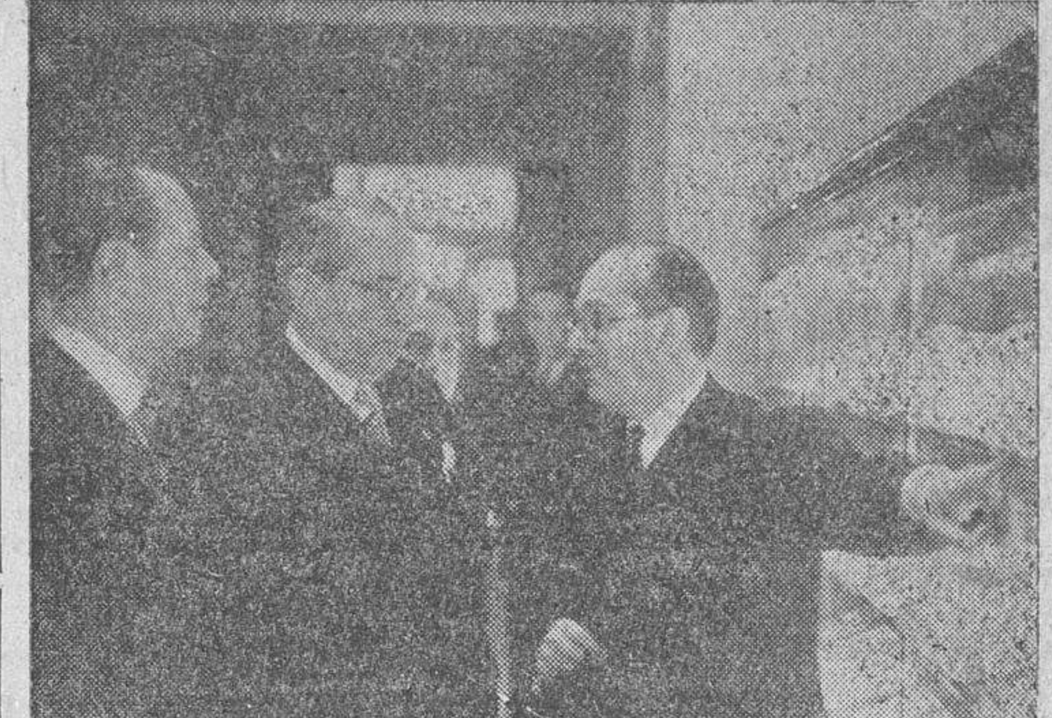
El doctor Arce, acompañado del ministro de Educación Nacional y del embajador de su país, doctor Radio, durante la visita a los edificios del Consejo Superior de Investigaciones Científicas.

Le acompañaron el ministro de Asuntos Exteriores y el Embajador Argentino