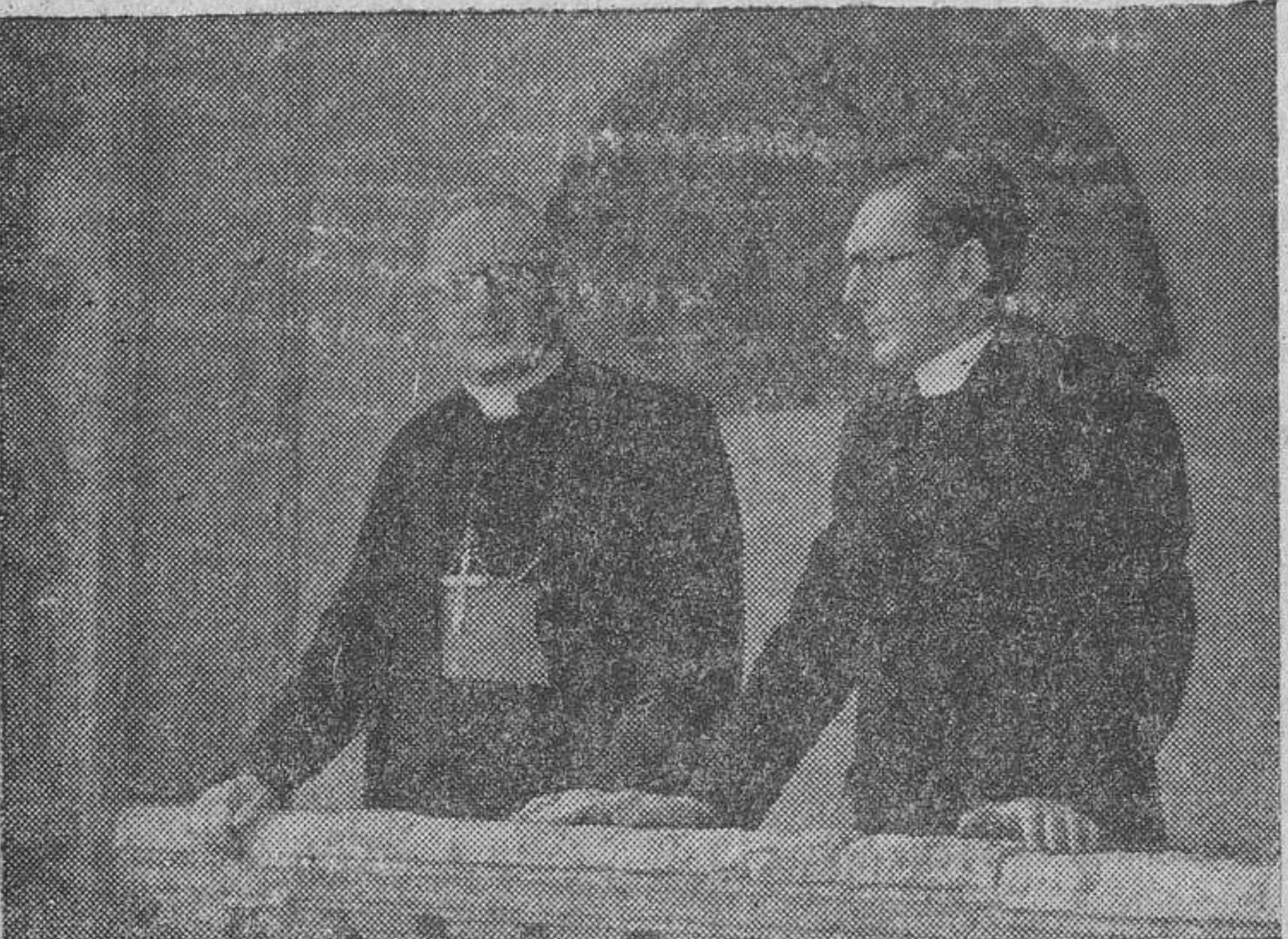
El excelentísimo y reverendísimo señor obispo de Gibraltar, monseñor Fitzgerald, acompañado del señor rector del Colegio de Nobles Irlandeses, de Salamanca, en los claustros de este Centro, durante la estancia del ilustre Prelado en nuestra capital.

A monseñor Fitzgerald le ha impresionado el progreso de la ciudad